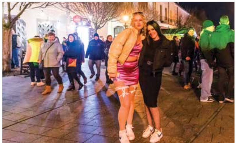
Aki csak élvezte a forgatagot, az is jól érezte magát