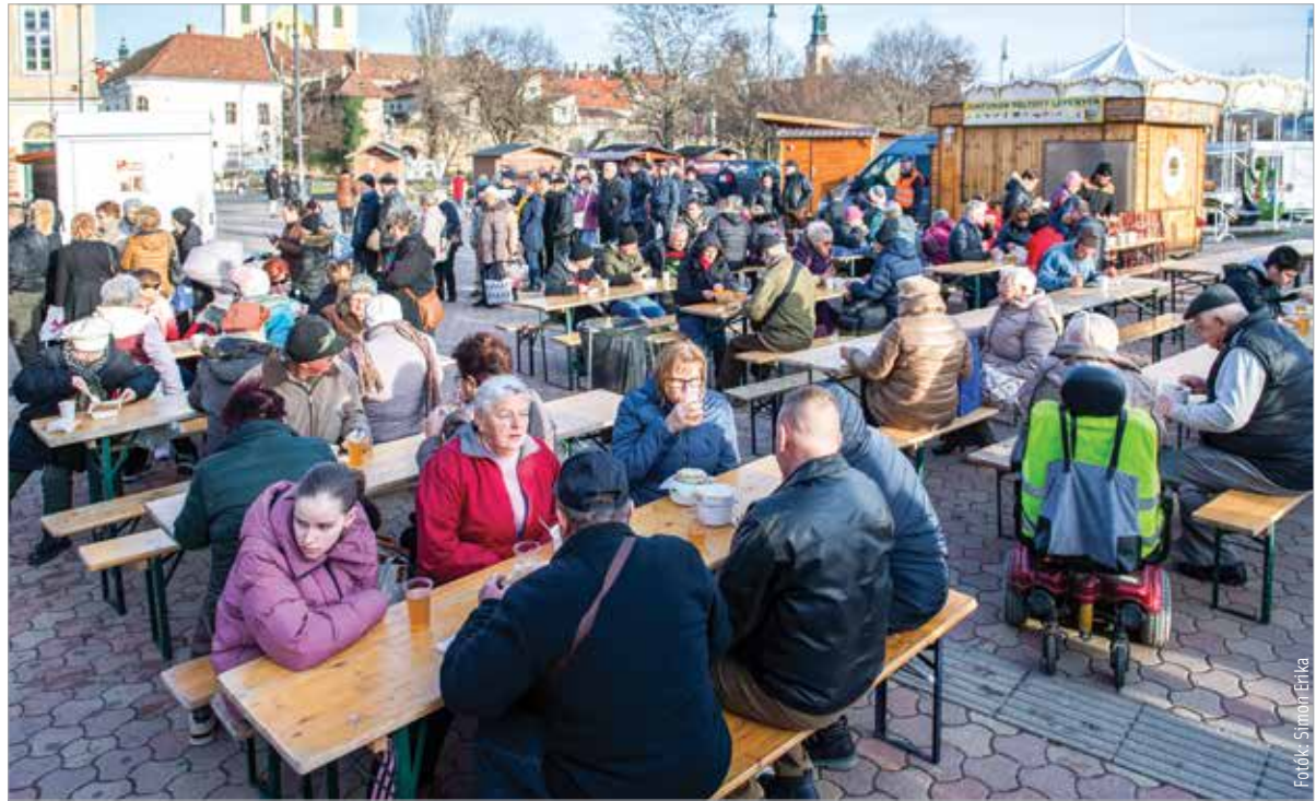
Ezerötszáz adag ízletes étel készült, amit hétfőn délután közösen fogyasztott el a város apraja-nagyja

„Szép hagyomány, hogy az új év első napján lencsét eszik a magyar, és a családok így kívánnak egymásnak az egész esztendőre jó szerencsét és boldogságot. 2013 óta az év nyitá-