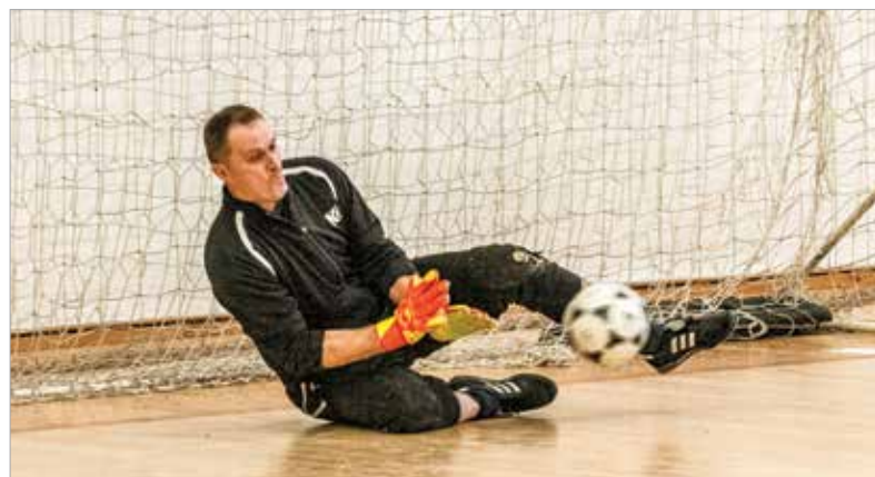
Nemcsak gyönyörű gólok, de nagy védéseket is láthattak a nézők