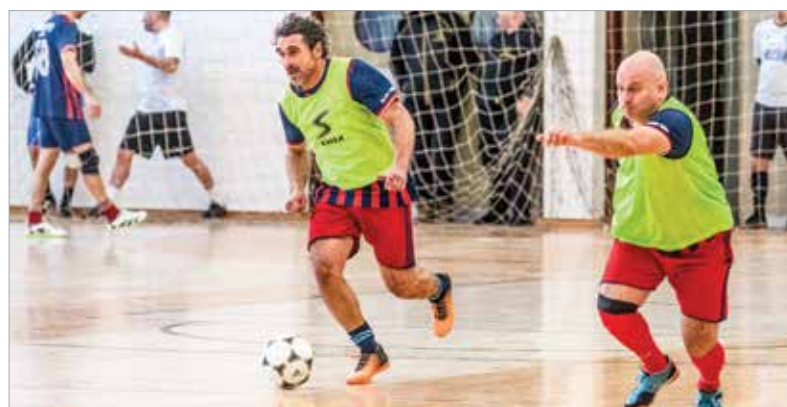
A labdarúgás szerelmesei hat tornát követhettek figyelemmel