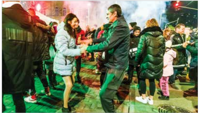
Felcsendültek többek között az ABBA, az Ottawan, az Eruption, Gloria Gaynor és Donna Summer táncos slágerei is