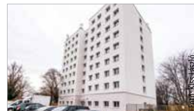
Már az állványok is lekerültek, kívülről is látványos a változás

Hamarosan befejeződik a nővérszálló épületének felújítása, mely egyike a Szent György Kórház elmúlt tíz évben megvalósuló fejlesztéseinek – számolt be róla közösségi oldalán Cser-Palkovics András. A polgármester elmondta: az elmúlt évtizedben számos fejlesztést tudtak végrehajtani a kórházban, köztük két új kórházi tömb építésével és a szülészeti-nőgyógyászati teljes megújításával. „A Szent György Kórház régióink, megyénk és városunk legfontosabb egészségügyi intézménye, egyben egyike a legnagyobb munkáltatóknak is. Az itt dolgozó orvosok, ápolók és segítők körülményeinek, juttatásainak javítása alapvető fontosságú, amit a bérek mellett esetenként a lakhatással is lehet segíteni. Kórházunk orvos- és nővérszállójára már igencsak ráfért a felújítás, mely kívülről is igen látványos, hiszen megtörtént a homlokzati szigetelés, korábban pedig a nyílászárók cseréje. A kivitelező kisebb-nagyobb belső beavatkozásokat is elvégzett az épületen, sokkal energiatékonyabbá és komfortosabbá tette azt!” – írta a polgármester, azt is kiemelve, hogy a Szent György