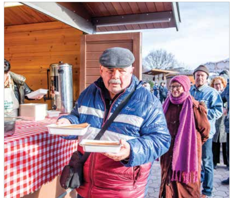
Az elmúlt évek során igazi közösségi programmá nőtte ki magát a szerencsehozó lencse közös elfogyasztása

Az apró szemű hüvelyeshez a néphit a pénzt és a gazdagságot társítja: minél többet fogyaszt belőle valaki az év első napján, annál nagyobb szerencséje lesz, és bőség jellemzi majd az évét.