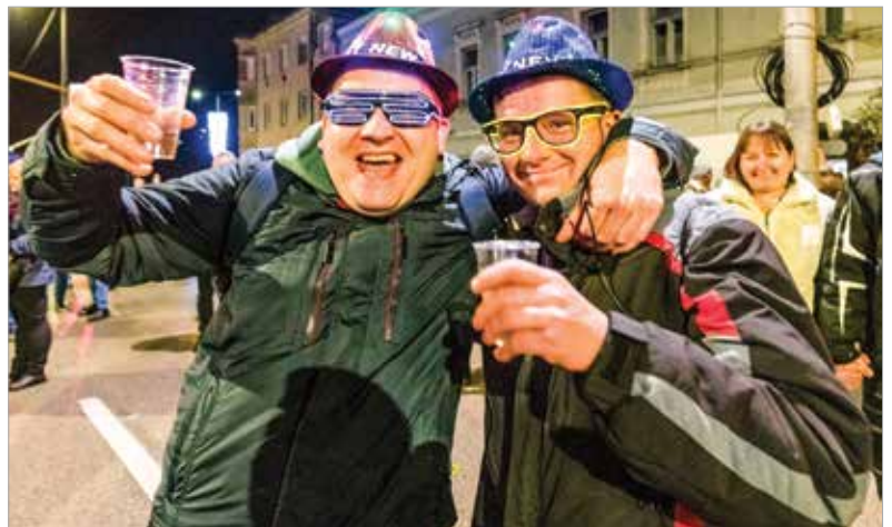
Az óév alaposan el lett búcsúztatva!