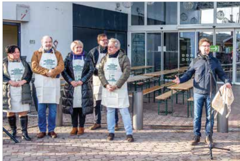
A polgármester kiegyensúlyozottabb, békés, nyugodt, boldog új esztendőt kívánt a fehérváriaknak

nyaként bevezettük ezt a város közössége életében is. Lencsével indul az év, köszönhetően a katonáknak, köszönhetően azoknak az embereknek, akik segítenek nekünk, hogy a szerencsehozó étellel köszönthessük a fehérváriakat. Bízom benne, hogy mindenkinek békés, nyugodt, boldog és szerencsés éve lesz!” – fogalma-