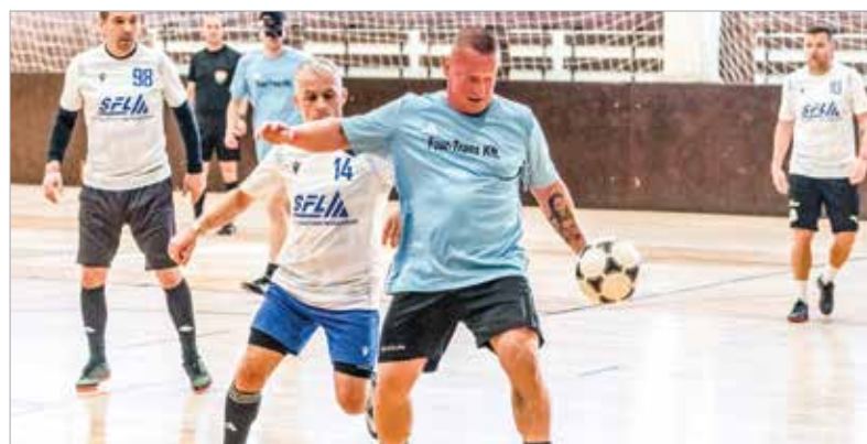
Közel ezer játékos lépett pályára