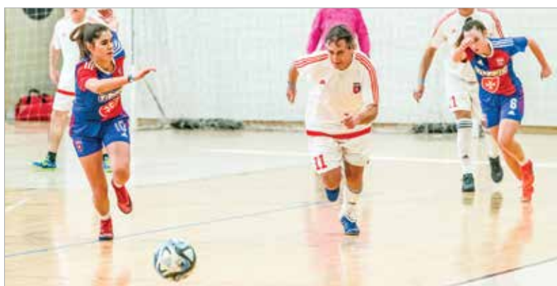
A Videoton-öregfiúk sorozatban háromszor nyerték meg az MLSZ által kiírt bajnokságot