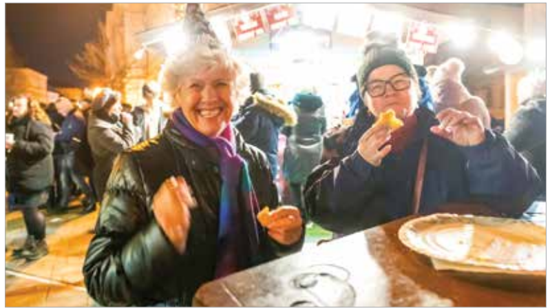
A zene mellett finom ételek és italok is várták a belvárosban ünneplőket