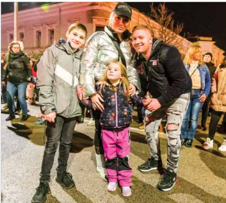
Sokan családotól érkeztek köszönteni az új esztendőőt