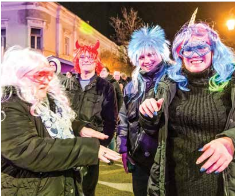
A színes paróka kedvelt kiegészítő volt ezen az éjszakán