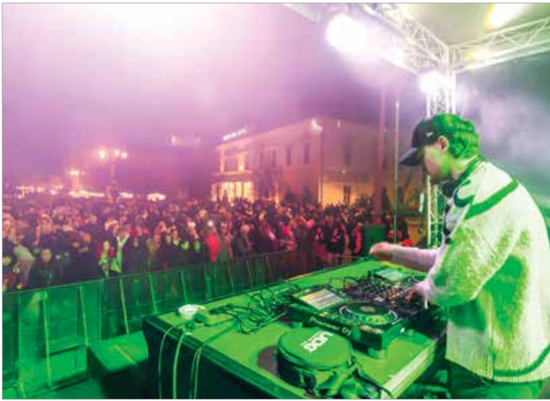
Rengeteg zenei stílusból merítették a fellépők az ünneplők örömeire