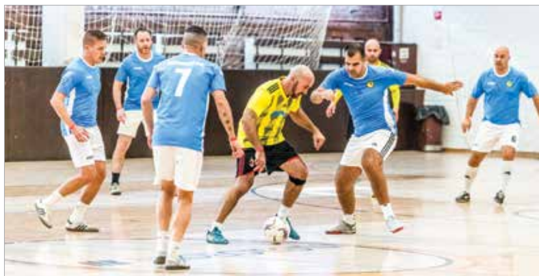
A Kiss Lajos Öregfiúk Kupát a Sárépszer csapata nyerte meg