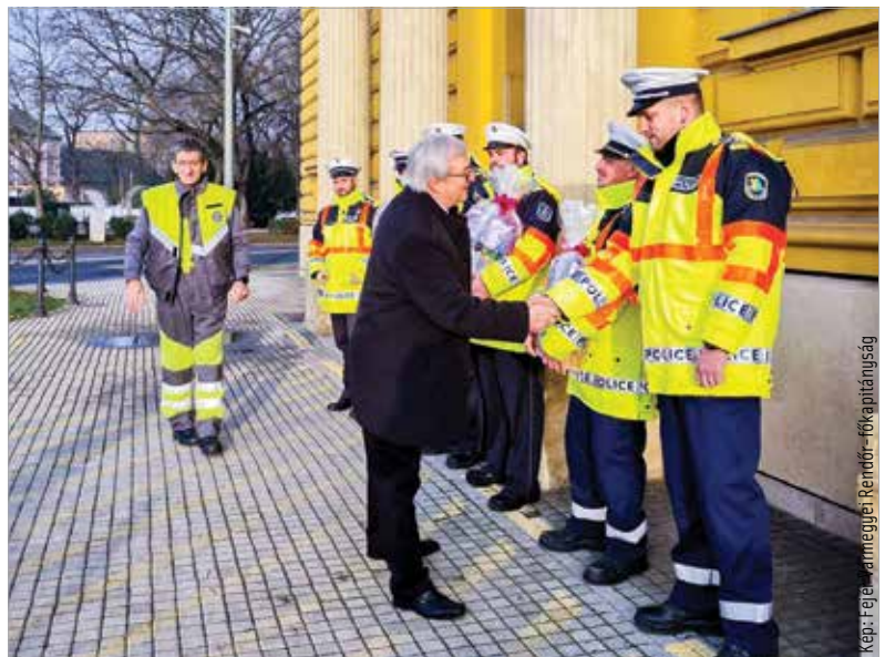
A magas szakmai színvonalon végzett munkát ismerték el