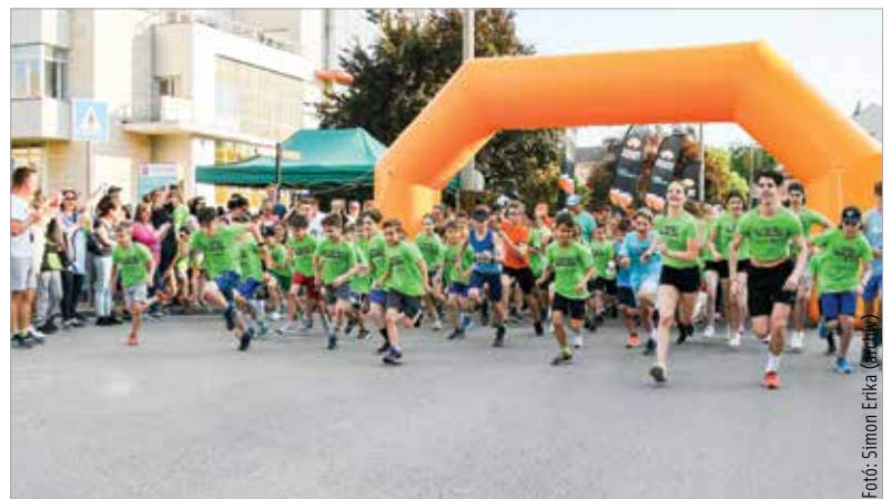
Idén is sok indulót várnak a tömegrajtos Depónia-futásra

A futás alatt a Vár körúton és a Rákóczi úton forgalomkorlátozás várható. A buszok módosított útvonala és a forgalmi rend változásai az arakatletika.hu/tesz oldalon megtalálható.