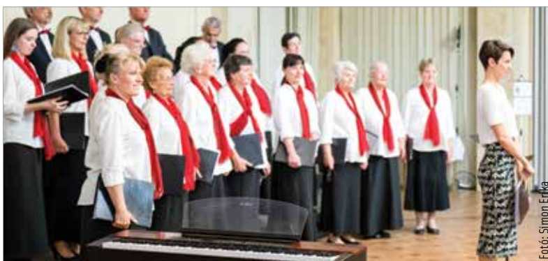
A Hotel Magyar Király kupolatermébe Kincseink az évszakok címmel invitálta a kórusmuzsika barátait vasárnapi koncertjére a Primavera Kórus. A fellépéssel a természetvédelem fontosságára szerették volna felhívni a figyelmet.