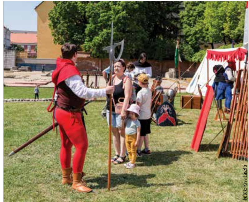
A középkori fegyverek bemutatója mindig népszerű az ilyen eseményeken

A rendezvénynek az a célja, hogy felhívja a figyelmet a nemzeti emlékhelyeken található értékekre. Székesfehérvár a kezdetektől csatlakozott a kezdeményezéshez.