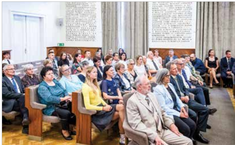
A fehérvári atlétika korábbi és jelenlegi versenyzői, edzői töltötték meg a Városháza Dísztermet