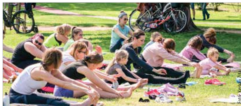
A Haleszban vasárnap a sport került fókuszba: egyéni és csoportos edzéslehetőségek is várták a mozogni vágyókat