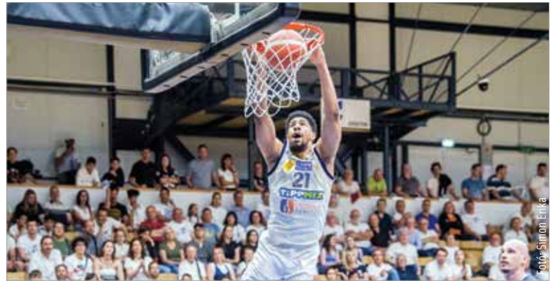
Nem fejtett ki érdemi ellenállást Barnettékkel szemben a Zalaegerszeg

maradt még motivációja az Albának, mert a bronzcsatában kétszer is igen simán verte a ZTE gárdáját. Itthon huszonhét, idegenben tizenhat ponttal nyertek Vojvodának, pedig az alapszakaszban kikaptak az egerszegi csarnokban. Ezek után nem nagyon lehet kérdés, hogy pénteken lezárhatják a párharcot, és ezzel a szezon is. Érdekeség, hogy 1996-ban a klub első érmét – szintén egy bronzot – ugyanígy a ZTE ellen szerezte az akkori Albacom. Azóta rengeteg érmet gyűjtött be a csapat, és a harmadik hellyel újfent bizonyíthatná, hogy továbbra is a magyar kosárlabda meghatározó egyesülete.