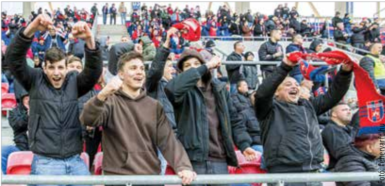
A szezonban utoljára szurkolhatunk a csapatnak, mely tavaly majdnem kiesett, idén pedig dobogón is zárhat

Kisvárdá ellen. Miután szinte egész tavasszal dobogón állt a Fehérvár, csalódás lenne, ha az utolsó pillanatban lecsúszna róla, bár a nemzetközi kupaindulás a negyedik hellyel is biztos. A szombati meccsre a C1-C6 és D1-D6 szektorokba kedvezményes belépőt válthatnak a szurkolók, ezzel szeretné az önkormányzat segíteni, hogy minél nagyobb biztatlásban legyen része a csapatnak. A meccs szombaton 17.45-kor kezdődik. Kérjük, hogy aki teheti, váltsa meg online vagy elővételben a belépőjét, illetve aki személyesen szeretné ezt megtenni, az érkezzen időben, nehogy lemaradjon a kezdésről!