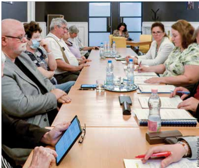
Elfogadták a Helyi Választási Bizottság tagjai a polgármesterjelöltek, az egyéni választókerületek jelöltjei és a nemzetiségi önkormányzati választások szavazólapjait

Azt is ellenőrizték a tagok, hogy a jelöltek kérése szerint a második név, a titulusuk elhagyása vagy szerepeltetése megfelelő-e a lapokon, illetve hogy a jelölőszervezetek logója jól van-e feltüntetve, egyforma méretű betűk és logók