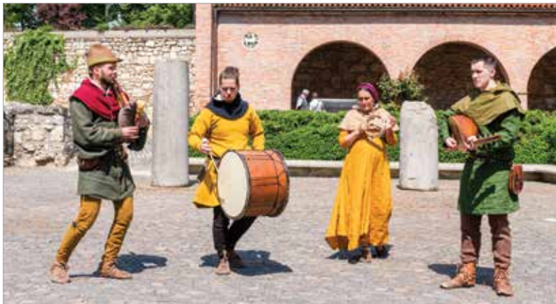
Az előadások, bemutatók mellett az autentikus zene sem hiányozhatott

Emlékhelyek Napján. A Magyar Királyi Kardforgatók rendje fegyverkiállítással és fegyvertechnikai ismeretőkkel várta a gyerekeket a Nemzeti Emlékhelyen kiépített katonai táborban. Az érdeklődők a hagyományörzők felügyelete mellett kézbe vehették a kor fegyvereit, a lemezpáncélt, vagy éppen magukra ölthettek egy középkori páncélzatot. A résztvevők a hagyományörzők bemutatója mellett a múzeum állandó kiállításait is megtekinthették a nap folyamán.