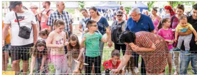
A vasárnapi tóvárosi esemény egyik legnépszerűbb programja a kisállat-simogatás volt

Az elmúlt hétvégén két fehérvári helyszínen is több száz érdeklődő vett részt vidám, szórakoztató és sportos programokon. Tóvárosban és a Haleszban is volt lehetőség kikapcsolódni.