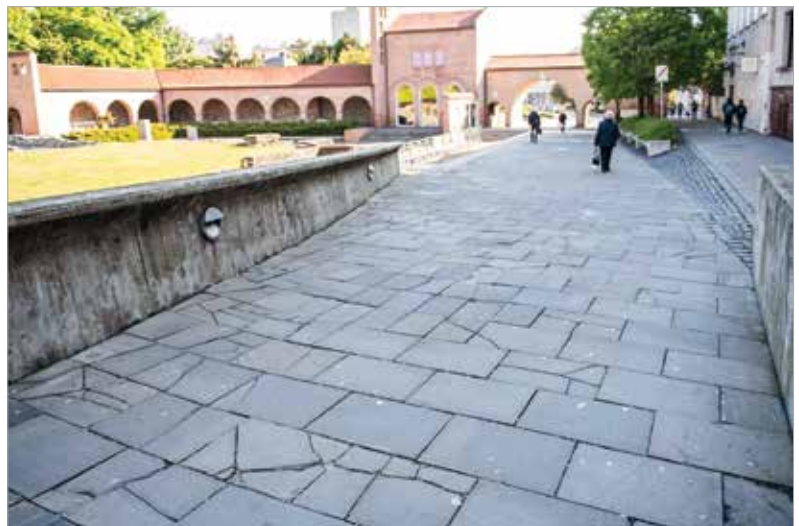
A felújítás megkezdéséig mindenki fokozott figyelemmel közlekedjen a területen!

Mivel kiemelt műemléki területről van szó, így a használandó alapanyagok és technikák kiválasztása is rendkívüli gondossággal kell, hogy történjen mind az ízlés, mind a jogszabályok terén – tette hozzá a polgármester.