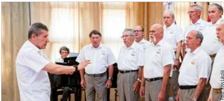
Szombaton a Hermann László Zeneművészeti Szakközépiskola dísztermében rendezték meg a Szent István Vároša Nemzetközi Kórustalálkozót a Vox Mirabilis Kamarakórus rendezésében. A helyi kórusokon kívül Budakalászárról, Siófokról és a felvidéki Ipolyságból is érkeztek fellépők.