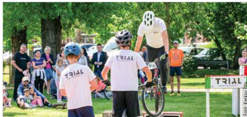
A látványos bemutatók sem hiányozhattak a sportligetben rendezett piknikről