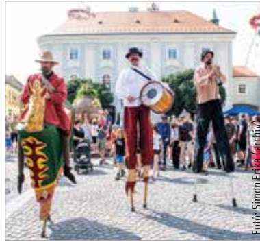
A kétnapos fesztiválon idén is mókáznak majd a gólyalabasok, de a látogatókat Paprika Lancsi csúszliddája, táblás játékok és mesetársas is várja

tében gyűjtött játékokat pedig az Igazgyöngy Alapítványnak ajánlják fel a szervezők.