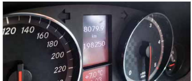
Minél idősebb egy autó, annál nagyobb a futásteljesítménye. Nem csoda, hogy vannak, akik szépíteni akarnak ezen!

Az elemzés egy apró horzsolást is sérülésként jegyez, szóval nem csak a komolyan összetört gépkocsik rontják a statisztikát. Eppen ezért is érdemes alaposan utánajárni a kiszemelt járgány előéletének, illetve fontos a korrekt állapotfelmérés, hogy később ne rémálom legyen a kedvenc fenntartása!