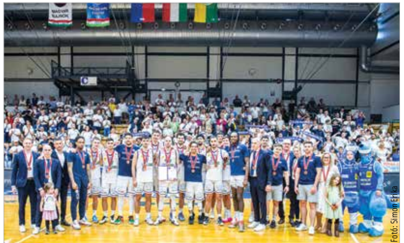
Csaknem telt ház ünnepelte a fehérvári kosárlabda-tizenhetedik bajnoki érmét

után azonban a ZTE elleni bronzcsatában ismét domináltak a mieink, így múlt pénteken, a harmadik sima győzelem után átvehették a megérdemelt érmeiket. Ez a klub történetében a nyolcadik szezon, aminek bronz lett a vége. Ot arany és négy ezüst mellé kerülhet a vitrinbe, ráadásul a legutóbbi három idényben egyaránt érmet szereztek a mieink. Ösztől így ismét európai meccseket játszhat az Alba, persze kérdés, milyen kerettel. Biztos, hogy lesz átalakulás, bár az ideai csapat nemcsak jó, de kifejezetten népszerű is volt remek karakterei miatt. Hogy kik maradnak és érkeznek, a következő két hónapban kiderül.