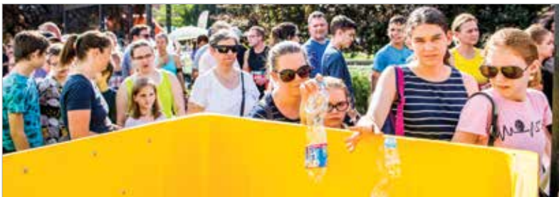
A fő támogató Depónia célja, hogy legyen minél több rendszeresen sportoló ember a tiszta, egészséges városban. A Depónia-futásra idén is egy széttagosított PET-palackkal lehetett nevezni, cserébe ajándék pólót kaptak az indulók.