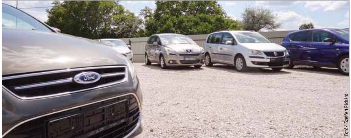
A szervizek bontás nélkül nézik át az autókat, vagyis a rejtett hibákat ők sem szűrják ki

Az elmúlt évek tapasztalatai alapján komoly összefüggés van az autók kora és a csalások gyakorisága között, amit használt jármű vásárláskor mindenképpen érdemes figyelembe venni! Az elemzés szerint