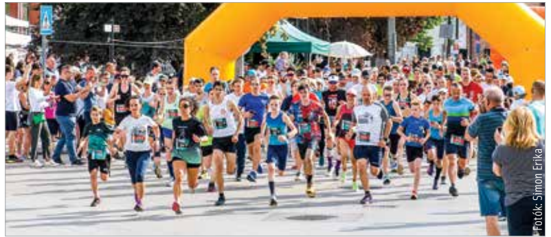
A TESZ-futást méltán nevezhetjük városunk egyik legnépszerűbb tömegsportrendezvényének. Ezúttal minden eddiginél többen neveztek. A sportbarátok idén is 4,8, illetve 11,2 kilométeres távokon, valamint háromfős váltóban indulhattak.