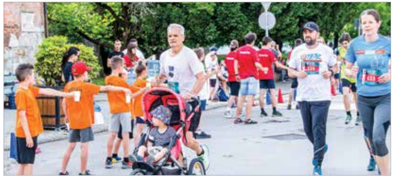
Volt, aki segítséget kapott a táv teljesítéséhez