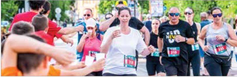
A nyári meleg sem tántorította el a futókat

Pünkösdhétfőn sportos fehérváriakkal telt meg a belváros: tizenharmadik alkalommal rendezte meg a Tiszta, Egészséges Székesfehérvárért futóversenyt az Alba Regia Atlétikai Klub a Depónia Nonprofit Kft.-vel és a város önkormányzatával közösen. A TESZ-futáson most is sokan tettek az egészségükért, és sikeres volt a Depónia-futás is, ahol ezerötszázan álltak rajthoz.