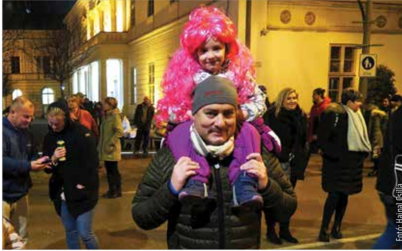
Már kora este sokan sétáltak a Fő utcán, és készültek az ünneplésre

Hangos, nyüzsgő szilveszteren vagyunk túl: a tavalyi, szolid ünneplés után idén újra közös bulit tartottak a belvárosban, és persze az újévi lencse sem maradhatott el. Lássuk, hogyan köszöntötte az új évet Székesfehérvár!