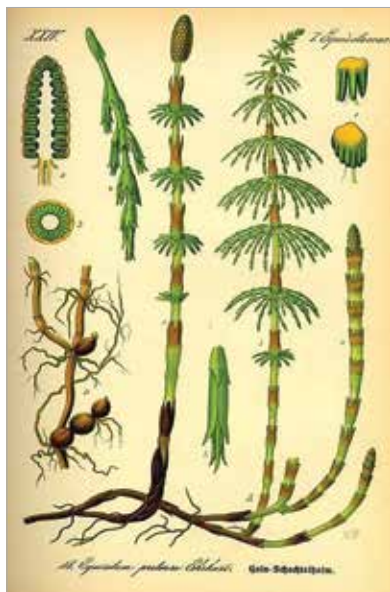
Mezei zsurló ( Equisetum arvense ) és alkotórészei a szakirodalom ábrázolása alapján

le, és kortyolgassuk el, miközben a gőzét is belelegezzük! Az is felszabadultabbá teszi a légzést, ha kakukkfűves fürdővízben áztatjuk magunkat egy kicsit. Ha este köhögési roham törne ránk, szippantsunk bele illó-