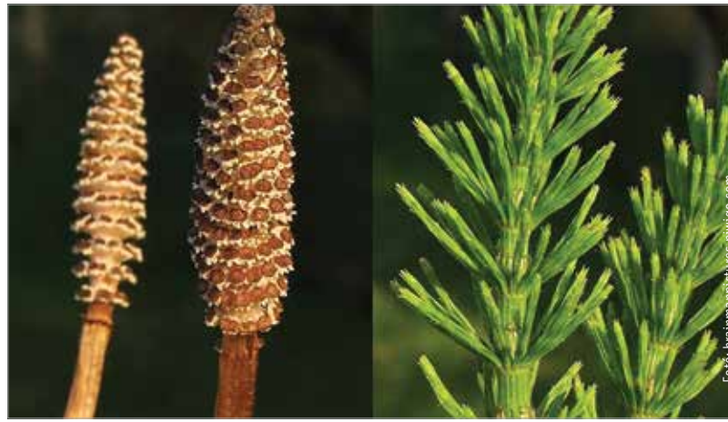
A mezei zsurló fiatal hajtásait június-augusztus folyamán érdemes gyűjteni

az emésztést, gyógyítja a sebeket, segít a vesemedence-gyulladások, hüvelyi fertőzések megjelenésekor. Köszvényes embereknek is ajánlott, hajhullásra is javasolni szokták, valamint gyenge és töredező körömnél, az ödémás lábakra, a fogíny gyulladására is javallott. Mindemellett legyőzhetjük vele a mandulagyulladást és a köhögést is. Sőt torokfájáskor is nagyon hatásos, ha gargarizálunk vele!