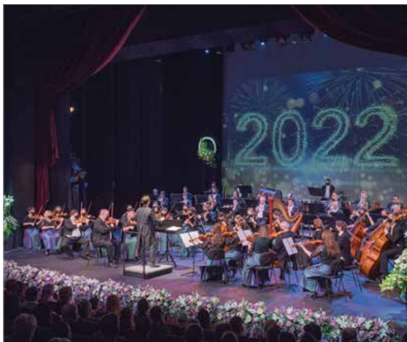
Telt ház fogadta a szimfonikusok évnitő koncertjét

magas szintű zenei munkája egyre inkább beérik: „A klasszikus, bécsi ízű Strauss-műsort igyekeztünk egy kicsit átírni, az összeállítás tartogatott meglepetéseket a közönségnek. Örülök annak, hogy az ünnepi időszakban nagyon biztató nézőszámokat tapasztaltunk a koncertjeinken. Nem tudjuk megjósolni, hogy a járvány milyen irányt vesz, de bízunk abban, hogy mindig előben játszhatunk, hiszen fontos a muzsikuskok és a közönség közötti kapcsolat!”