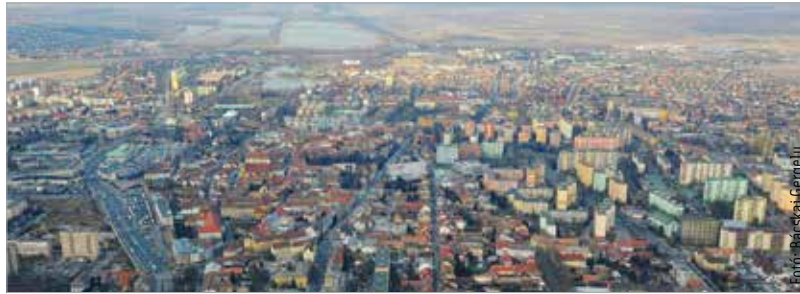
Idén várhatóan tovább növekszik Fehérvár gazdasága

Tavaly év elején a különleges gazdasági helyzetre való tekintettel tizenötmilliárd forintra becsülte a városvezetés az iparüzésiadó-bevételt, ehelyett 17,8 milliárd lett, ami a tervezett összeg 119%-a, vagyis a vártnál sokkal jobban teljesítettek a helyi vállalkozások: „A kis- és középvállalkozások számára adott