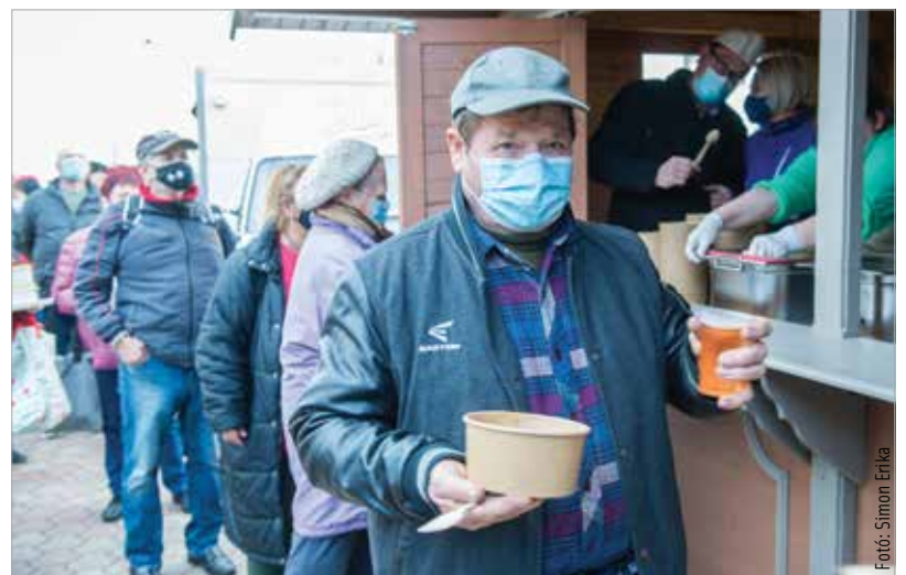
Bőséget és szerencsét hozott az új év azoknak, akik kilátogattak a lencselakomára: idén is ezer adag finomság készült az újévi étekből, melyhez a néphit a pénzt, a gazdagságot társítja: minél többet eszik belőle valaki ezen a napon, annál nagyobb szerencséje lesz e téren, és bőség jellemzi majd az évét!