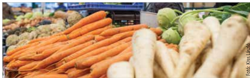
A kereskedelmi forgalom ősztől öt-hat százalékos növekedést mutatott az előző évhez képest

A kereskedelmi szövetség fűtőkára arról is beszélt, hogy a kormányzati intézkedések, az adóvisszatérítés, a tizenharmadik havi nyugdíj és a minimálbér-emelés februárban kilencszázmilliárd forint pluszjövedelmet jelentenek a háztartásoknak, ami meg fog látszani a kereskedelmi forgalomban is.