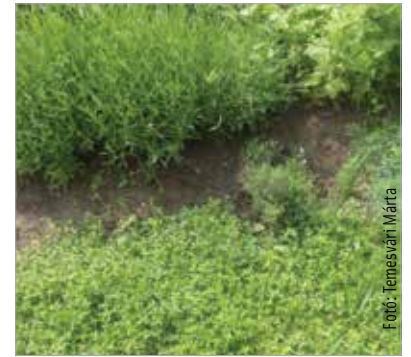
Kerti és mezei kakukkfű a levendula szomszédságában

A legtöbben köhögés, torokfájás és görcs fellépésekor próbálják ki fertőtlenítő, baktérium- és gombaölő hatását. Görcsoldó és ingercsillapító, emiatt régen a samárköhögésben szenvedőket is megkínálták a belőle készült főzettel. Manapság kezelnek vele időskori tüdőtagulást, hörgőtágulást és idült hörghurutot. A kakukkfűben lévő hatóanyagok feloldják a letapadt váladékokat, amit így könnyebben fel tudunk köhögni.