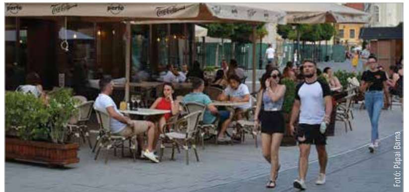
Fejér megye az élbolyba tartozik a boldogság és a pénzügyek terén

számmal. Ezt követi Pest (6,55) és Vas (6,48), alig valamivel lemaradva pedig a negyedik helyen Fejér megye áll, 6,42-os értékeléssel. A legboldogtalanabb megyének Heves számít a szubjektív lista alapján: az itt élők átlagosan 5,95-ra értékelték csupán a boldogságukat. Ötödik helyen végzett Fejér megye, amikor a személyes anyagi helyzetről és a pénzügyi biztonságról kérdezte a lap az olvasóit. Az ebben a rangsorban 6,4 pontot elérő megyénket Veszprém (6,7), Vas (6,54) és Pest (6,45) mellett a fővárosban élők (6,43) előzték csak meg. Pénzügyi szempontból a legkevésbé stabil megyének a válaszadók szerint manapság Békés számít, 5,5 ponttal.