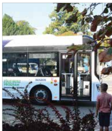
Városunkban is közlekedik elektromos busz a Zöldbuszprogramnak köszönhetően