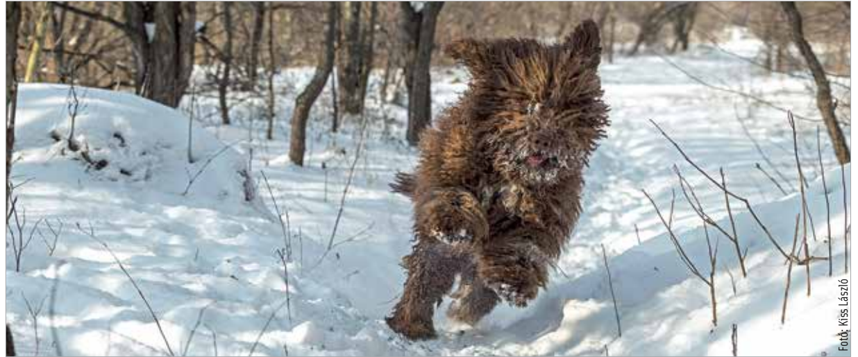
Kutyával több időt töltünk a szabadban, ami már önmagában jótékony hatású