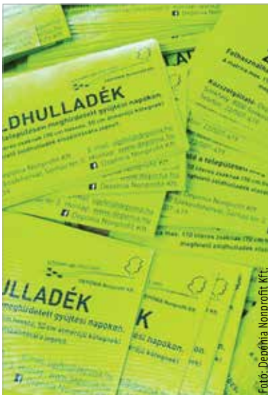
A Depónia honlapjáról a saját utcánkat kiválasztva tudjuk letölteni a hulladékszállítási naptárat

ingatlanuknál egynél több hulladékgyűjtő edény ürítését veszik igénybe, úgy a matricák akár több küldeményben is érkezhetnek, eltérő időben. Évente négyszer az üvegeket is elviszik a ház elől. Az első ilyen alkalom január utolsó hetében lesz a családi házas övezetekben. A zöldhulladékgyűjtés pedig március második hetében kezdődik Székesfehérváron.