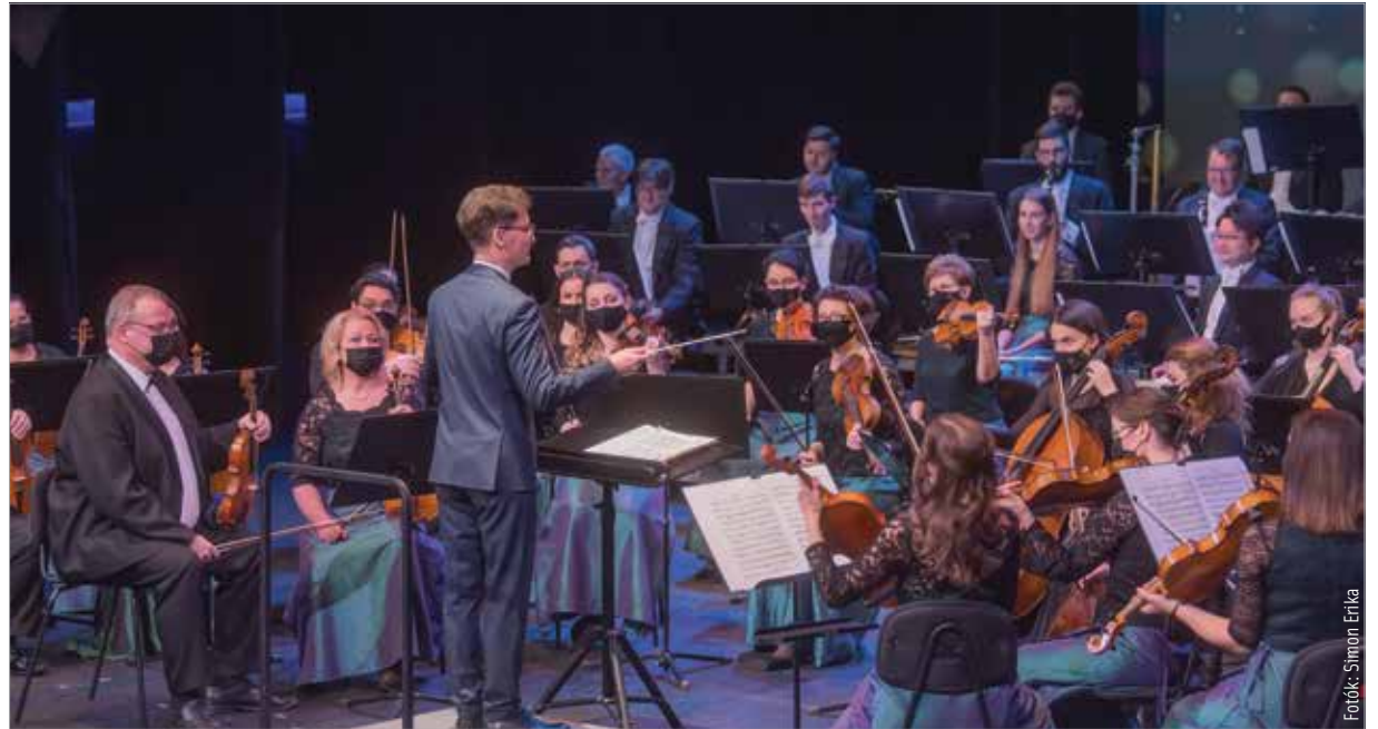
Cser-Palkovics András polgármester kezében a karmesteri pálcá

Ruff Tamás, a zenekar igazgatója örömeinek adott hangot, hogy a tradicionális esten olyan programot kínálhattak a közönségnek, amely Boross Csillának, a világhírű operaénekesnek köszönhetően egyedülálló zenei élménnyel gazdagította az est vendégeit: „A zenekarnak a legnagyobb öröm és ajándék, ha játszhat. Nagy öröm, hogy Boross Csilla művésznő elfogadta a felkérésünket, és első hí-