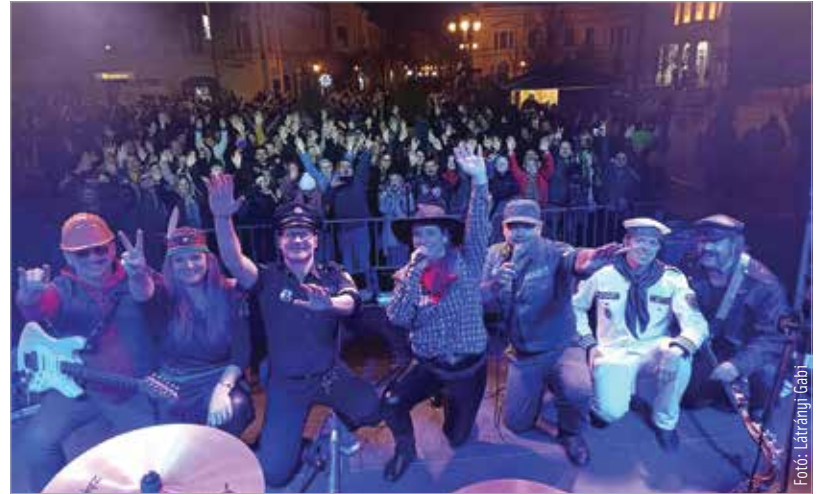
Ezt a fotót a Discover Band készítette a színpadról, háttérben a közönséggel