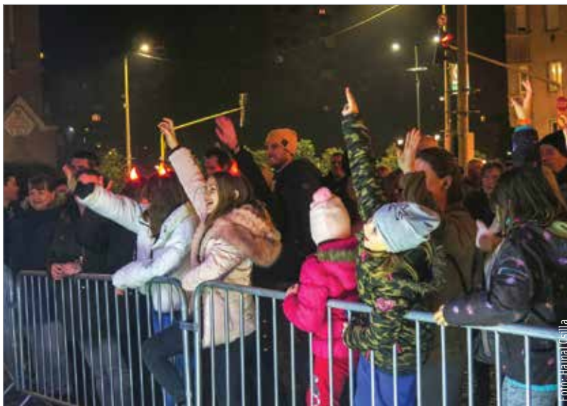
A Zichy ligetnél felállított szabadtéri színpadon este nyolckor kezdődtek a könnyűzenei koncertek