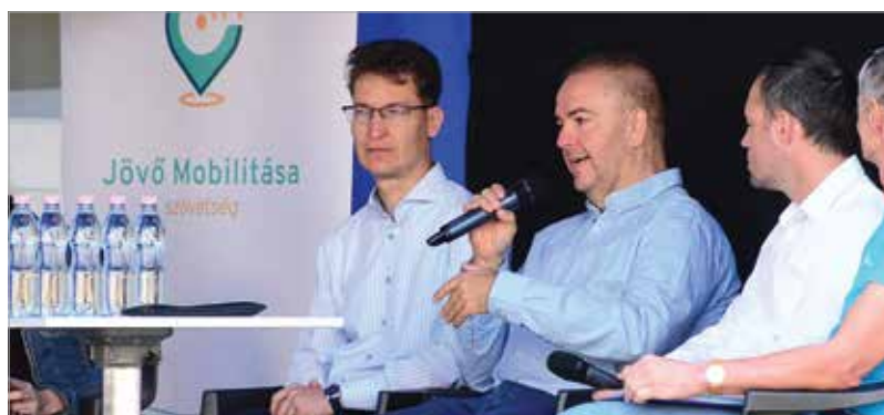
Néhány hónapja Fehérváron tartottak bemutatórendezvényt és kerekasztal-beszélgetést az elektromos járművekről

A megtakarítás tovább növelhető, ha valaki otthon tölti az elektromos autóját, mert akkor negyedakkora összegből is utazhat: otthoni töltés esetén – kilowattónként negven forinttal számolva – száz kilométer megtétele hatszáznyolcvan forintba kerül, miközben egy benzines autó esetében ez körülbelül kettőezer-nyolcszáz forint.