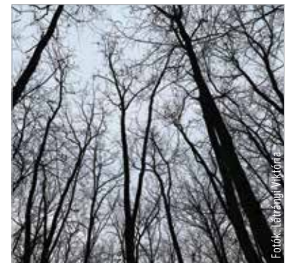
Érdemes néha letérni a járt utakraól, és felfedezni az erdő rejtett zugait!

1945 után az erdők közé zárt mezőgazdasági földek betelepítésével százötven hektárnyi új fiatalos nőtt a területre. Az erdő harmada középkorú, csak kis hányada idős állomány, többnyire tölgy, illetve fenyő, kisebb része akác és egyéb lombos fafaj. Egységét nádas, szántó, gyümölcsös, szőlő bontja meg – olvasható a fenntartó Vadex oldalán.