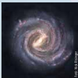
2022. jan. 13. – jan. 19.