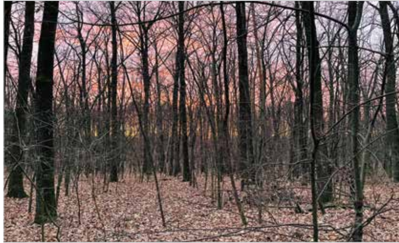
Mindig jó felkeresni a pentelei parkerdőt!

Sok év kihagyás után nyolc-tíz éve fedeztem fel újra a parkerdőt. Azért is szeretek oda járni, mert ha csak egy óránk van, ott akkor is tartalmasan el tudjuk tölteni az időt. Mindig találunk valami új dolgot, érdekességet