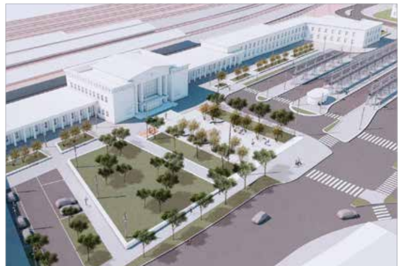
Új buszpályaudvar, parkolóház, felszíni parkoló, körforgalmak, kerékpárutak – ezek csak a főbb elemei a székesfehérvári vasútállomás intermodális átszállókapcsolatait fejlesztő óriásberuházásnak

célját. A tervezési és kivitelezési feladatokra nemrég írt ki ajánlattételi felhívást a NIF, vagyis a Nemzeti Infrastruktúra-fejlesztő Zrt. A fejlesztéssel Székesfehérváron nemcsak a vasút, valamint a helyi és a helyközi autóbuszok új találkozási pontja valósul meg, hanem a kerékpáros és a közúti közlekedés is fejlődni fog. A projekt Székesfehérvár és az egész megye közösségi közlekedését emelheti új szintre.