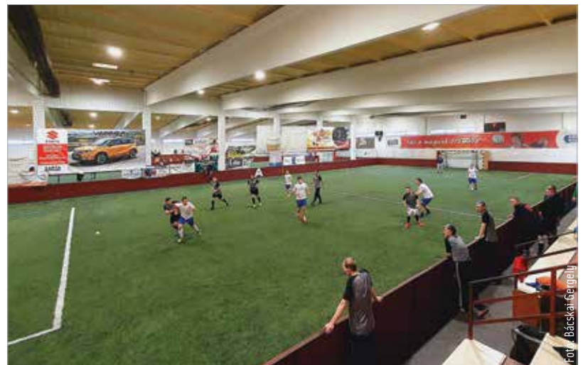
Öregfiúk fiatalos tempóban

rendelkező sportegyesülete az elmúlt időszakban komoly szintet lépett, és visszaszerezheti régi fényét ennek a közösségnek. Az öregfiúk tornáján tíz csapat vett részt, kora délelőttől délutánig zajlottak a meccsek a Főnix-csarnokban. A hangsúly tehát ezúttal a sok szakosztályt üzemeltető egyesület sportágai közül a focin volt. A tornát a Masterplast csapata nyerte, mögötte az ST Solar végzett a második helyen, a képzeletbeli dobogóra még a két harmadik helyezett, az Emerson és a házigazda MÁV Előre állhatott fel.