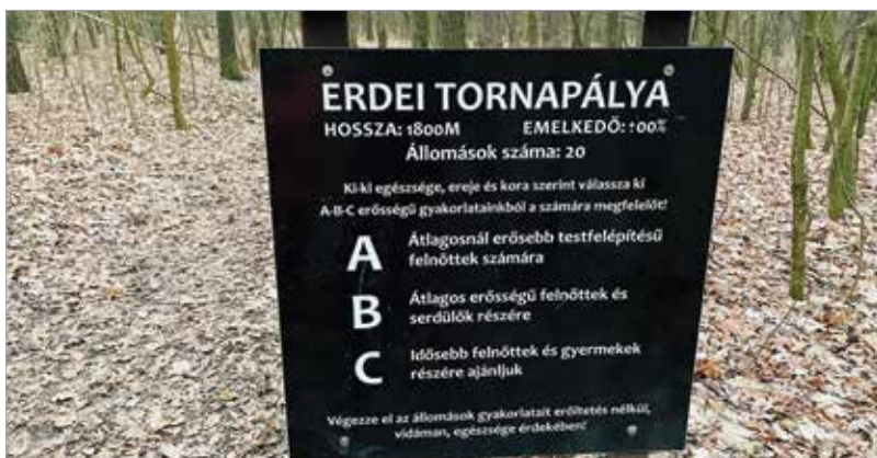
Nem lehet eltévedni, hiszen tájékoztató és ismeretterjesztő táblák jelzik, hogy hol és mi vár ránk