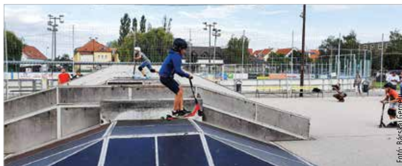
A pályán a sisak kötelező, és erősen ajánlottak a különböző védőfelszerelések is!

A görkorcsolya- és a BMX-pályára új, impregnált, csúszásmentesített lemezeket építettek be. Elvégezték a szerkezet statikai megerősítését is. A felújítás mintegy hárommillió forintba került. A belépők ára azonban nem változott.