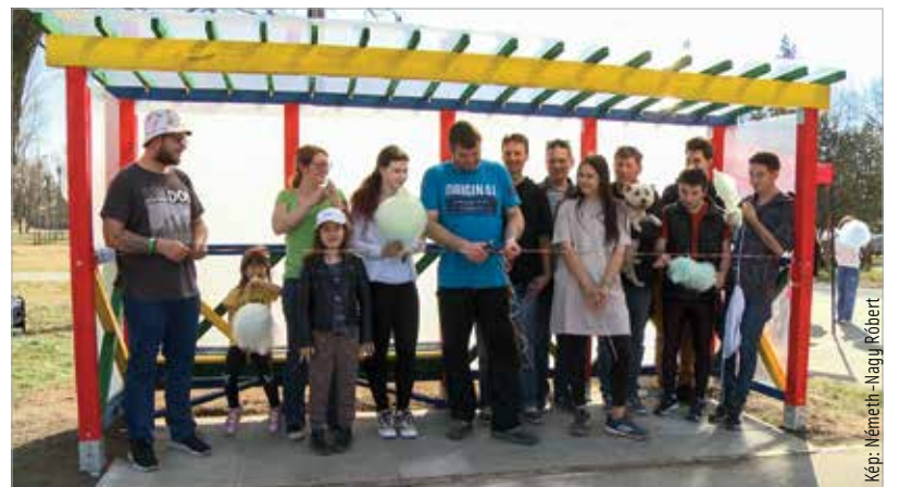
A vasárnap délutáni átadáson a szülőket ingyensörrel, a gyermekeket ajándék krétákkal és vattacukorral várták

„Ez Székesfehérvár első közfinanszírozású buszmegállója!” – ezt már Fenekes Roland, a Fejér megyei 1-es választókeretben induló képviselőjelölt hangsúlyozta, aki fontosnak tartja az „ingyensör” párt által szorgalmazott intézményét, melyhez vasárnap délutáni rendezvényükön is hívek maradtak. Fenekes Roland a régi fehérvári vidámpark újraindítását is szorgalmazza.