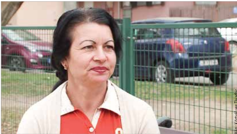
Krisztinának három napja érkeztek egy magyarok lakta faluból

A József Attila Kollégium melletti foci pályán egy csapat gyerek rúgja