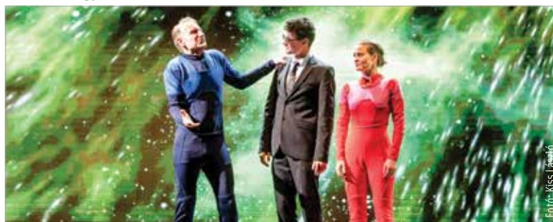
Az ember tragédiája 2.0 online is megtekinthető az eSzínház műsorán