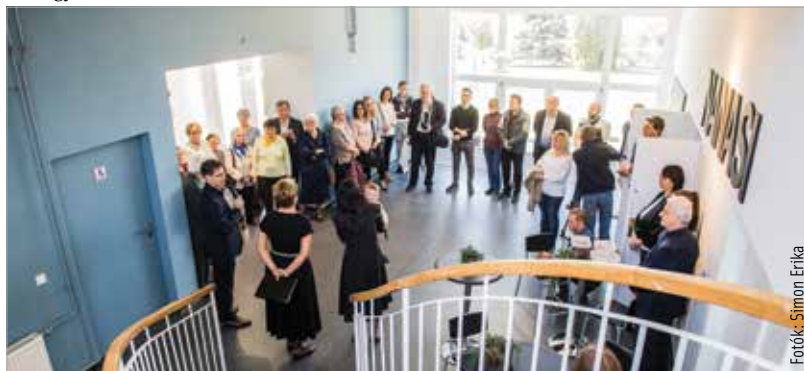
A Fanta-villa néven ismert, mintegy hetvenéves kultúrház esztétikai és műszaki renoválása, átalakítása januárban kezdődött, és a napokban fejeződött be. A földszinti rész megszépült, és vonzó közösségi téré alakult.