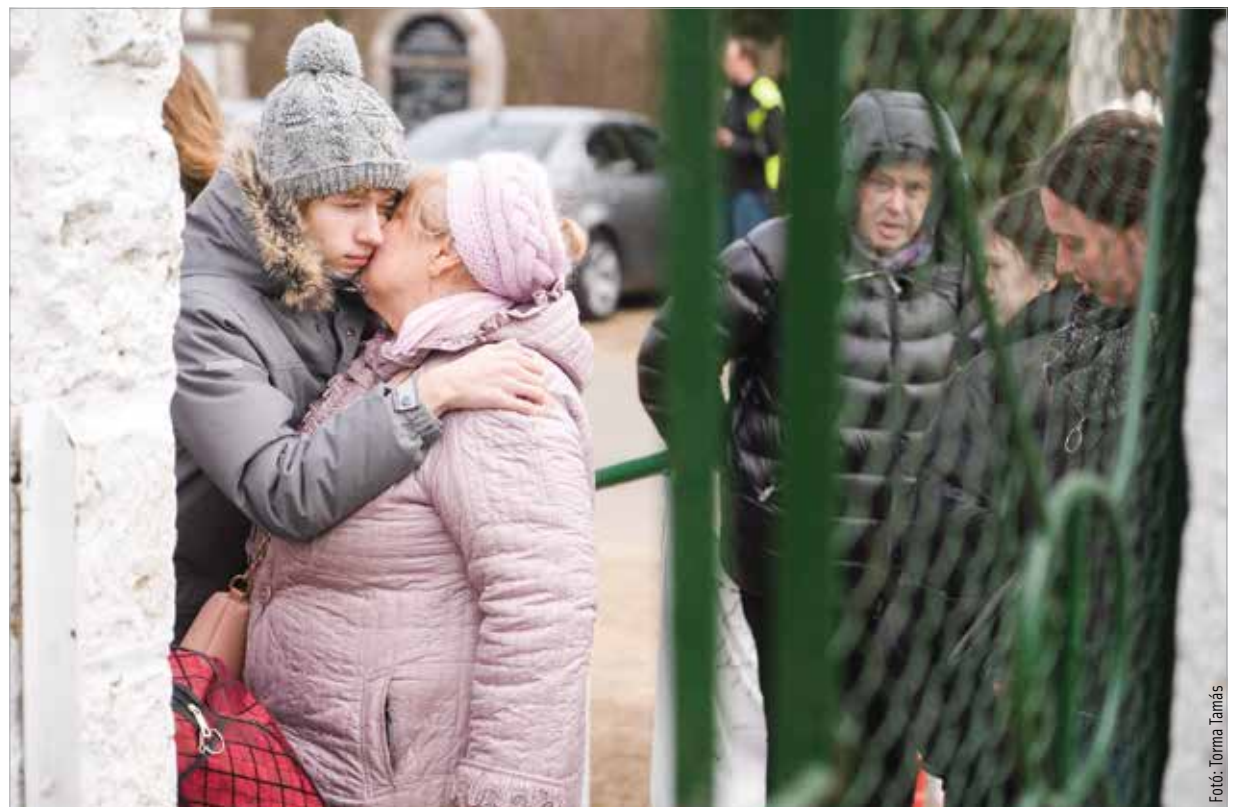
Találkozás a határnál

emberi oldal fogta meg: „Néztem a képeket, a videókat, és olyan tekinteteket láttam, amit valószínűleg a tükörben is láttam volna, ha én lettem volna ilyen helyzetben. Kettős érzés volt hazajönni: lelkileg nagyon megterhelő volt ez az egy hét, ugyanakkor örülök, hogy tudtam segíteni, és ez valamennyire feltöltött. Amikor visszaértünk Fehérvárra, befelé jövet elhajtottunk a Halesz mellett, a lakóházak mellett, és az volt a fejemben, hogy ezek az épületek még állnak! Beléptem az otthonomba, ami nem túl nagy, nem is túl gazdag, de mégiscsak az enyém. A biztonságot jelenti számomra, és közben tudom, hogy ezt mennyien elvesztették odakint!”