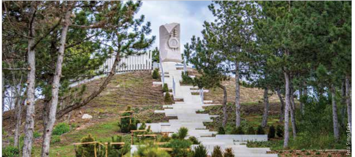
A fejlesztéseknek és a parkosításnak köszönhetően az Aranybulla-emlékmű ismét a kirándulók egyik kedvelt célpontja lehet!

A terület parkosítása során százötvenkét fát és több mint ötezer cserjét, valamint más növényt telepítettek, ami még impozánsabbá teszi a környezete-