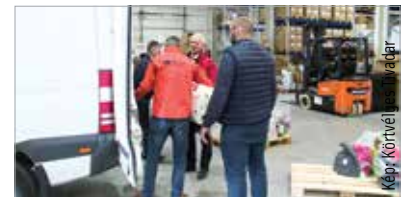
A Baptista Szeretetszolgálat a pákozdi logisztikai központban és a székesfehérvári, Tüzér utcai gyermekotthonban várja az adományokat hétköznap nyolctól négyig

Révész Szilvia hozzátette: sokan Kárpátalját már biztonságosnak találják, és ott várják a háború végét. Mint mondta, egyes információk szerint nyolcszáz ezer-egymillió belső menekült tartózkodik