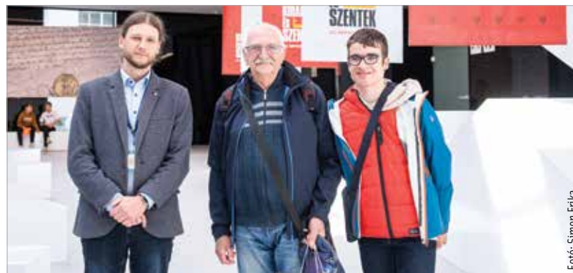
A kiállítás június tizenötödikéig minden nap reggel nyolc és este nyolc között látogatható a Szent István Király Múzeum megújult, Fő utcai épületében. További információ: www.arpadok.hu

Az elmúlt egy hónap alatt tízezer látta már a kiállítást. Az egyedülálló tárlat a 10–13. századból származó régészeti leleteket, könyv- és levéltári ritkaságokat, ereklyéket vonultat fel több mint negyven hazai és közel húsz külföldi intézményből. A műtárgyak tizenhét teremben, közel ezernyolcszáz négyzetméteren adnak képet az Árpád-korról. Számos kedvezmény igénybe vehető a jegyváltáskor, így például a családok, a diákok és nyugdíjasok, a csoportok, illetve a székesfehérvári lakhellyel rendelkezők számára. A hetven év felettiek pedig ingyenesen látogathatják a különleges tárlatot.