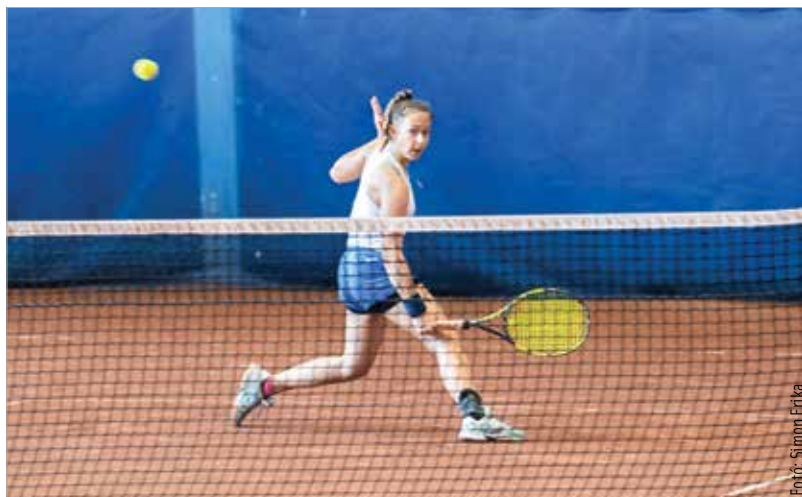
Hétfőtől vasárnapig külföldi és hazai junior játékosoké a főszerep