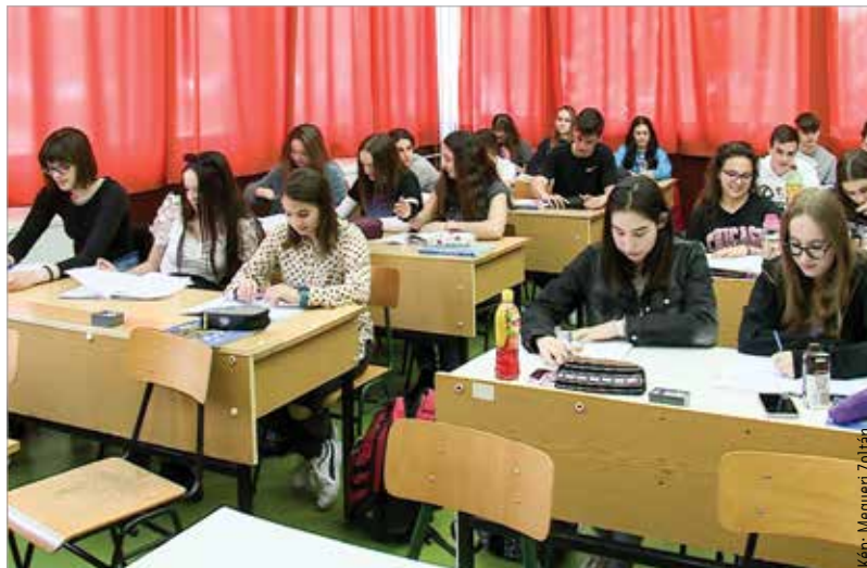
A diákok is büszkék lehetnek iskolájukra!

A Tópartiban nagy figyelmet fordítanak a nyelvoktatásra is. Kiváló eredményekkel rendelkeznek a tanulmányi és sportversenyek, az országos felmérések, az érettségi vizsgák, a továbbtanulás és a nyelvvizsga-bizonyítványok eredményeit figyelembe véve is. A művészeti szakgimnáziumi oktatás is magas színvonalú: a tanulókat jól felszerelt grafika-, kerámia- és textilműhelyekben oktatják.