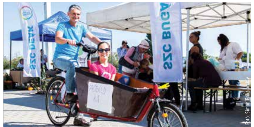
Interaktív programokkal várják a családokat

Színpadon a Bogárháton Társulat Mentsük meg a Földet bogárháton! és a Katica és a bogárgyerekek című mesejátéka. A látogatóközpontba az Alba Innovár a zöldrobotika világát hozza el: lesz legórobot-akadálypálya és a szelektív hulladékgyűjtő Dobot, az egykarú robot is szolgálatba áll.