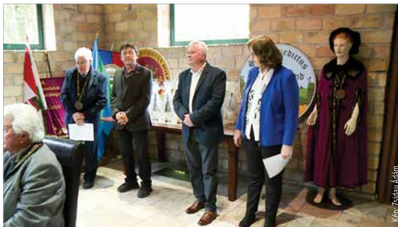
A borászok számára is fontos egy ilyen találkozó