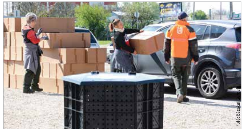
A komposztládákra tavaly ősszel, a Virágos Székesfehérvár program keretén belül lehetett pályázni. Idén is kora ősszel jelenik majd meg a pályázat.

A növénycsomagokat május 3. és 19. között osztják ki. Ehhez szakaszosan küldi ki a Városgondnokság az időpontfoglaló leveleket!