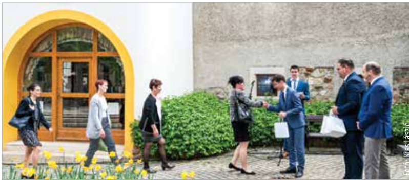
Immár sokéves hagyomány, hogy a ballagási hét keretében az Órajátéknál köszönti az önkormányzat a ballagó diákok osztályfőnökeit. A járvány okozta kétéves kihagyás után szerdán végre ismét összegyűlhetnek a pedagógusok és a diákok képviselői a Kossuth-udvarban.