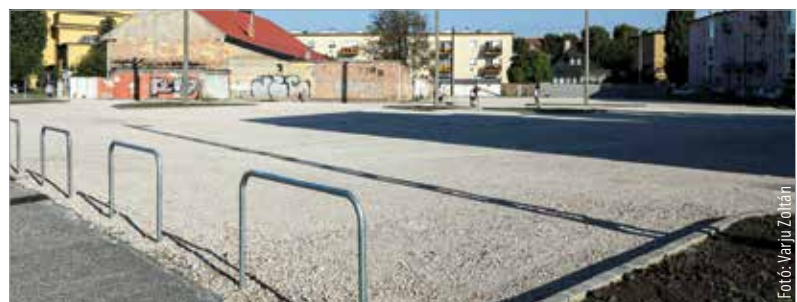
Kedden birtokba vehették az autósok a Vasvári gimnáziummal szemközti területen épült ideiglenes parkolót