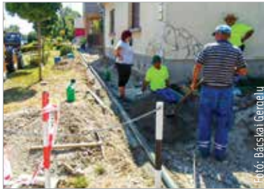
A kivitelezők a munka megkezdése előtt mindig egyeztetnek az ingatlanulajdonosokkal

A Városgondnokság ebben az esztendőben mintegy félmilliárd forintot költ a fehérvári utak és járdák felújítására. Több mint harminc helyszínen folytak-folynak beruházások. Az önkormányzati cég kétszázhatvanhárom kilométer hosszú gyalogutat és járdát üzemeltet. Ezek közül most több is megújult a Kőfém-lakótelep környékén. Elkészült a járdafelújítás a Budai út 165. előtt, és a Kőfém-lakótelep 11. és 36. között is megépült az új járda a központi út mellett, ahol korábban nem volt kiépített járdaszakasz. Elkészült a Rádió-lakótelepen a 21-es szám előtti járda felújítása, és a Hargitai utcában hamarosan továbbépül a több ütemben meg-