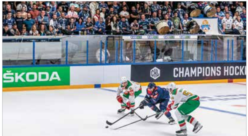
Telt ház és az ellenfeleket mindig meglepő katlanhangulat fogadta a Bajnokok Ligáját Fehérváron

várakozást, örömet, ami övezte a Volán történelmi bemutatkozását. Kevin Constantine, a fehérváriak mestere óriási tapasztalattal rendelkezik az efféle nyitányok terén. Utólag ki is emelte, hogy az első meccs mindig speciális. Éppen ezért a Zürichtől elszenvedett 7-1-es vereség nem értékelhető önmagában, viszont a Rögle elleni mérkőzés megmutatta, mennyit fejlődött az utóbbi időben a csapat. A BL svéd címvédője csak a hajrában fordította a maga javára a meccset, vagyis végig esélye volt a bravúros pontszer-