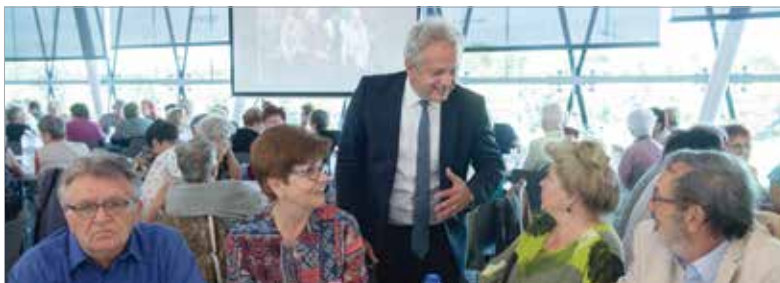
Másokért tenni, szeretettel. Ez az egyesület összetartó ereje! – fogalmazott Vargha Tamás, Székesfehérvár országgyűlési képviselője köszöntőjében

Az ünnepségen Cser-Palkovics András polgármesteri emléklappal