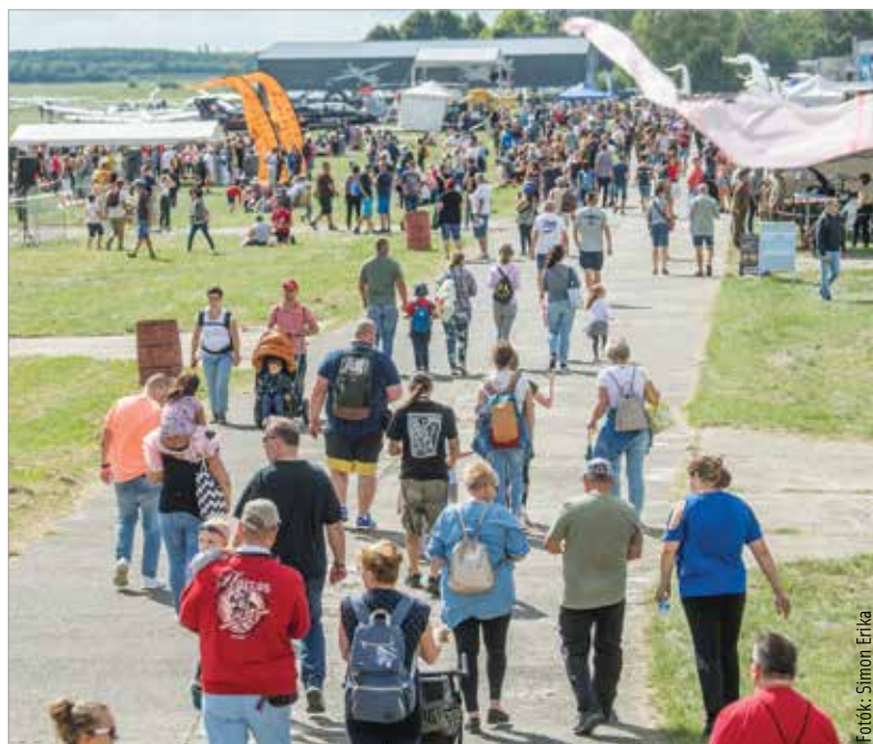
Bár hivatalosan nem tartják nyilván a repülőnapok nézőszámait, az idei eseményen talán minden eddiginél nagyobb volt az érdeklődés