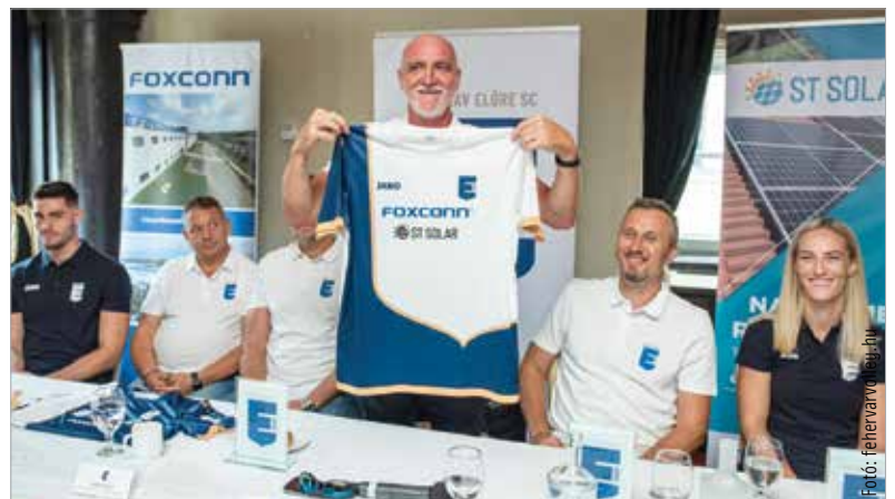
A klubelnök büszkén mutatja az új mezt, amit az Extraligában viselhetnek a fehérvári röpisek