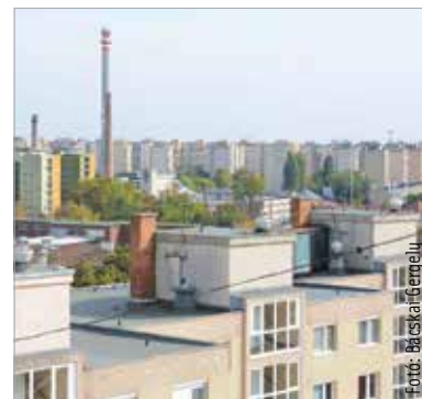
A távhő lakossági ára nem változik a következő fűtési szezonban

Az elmúlt másfél hétben több fontos adatról is tájékoztatta a fehérváriakat a polgármester. A rezsziárak drasztikus növekedése bizonytalanságot, kiszámíthatatlanságot eredményez, ami komoly veszélyt jelent minden település számára. Az intézkedési csomag előkészítéséről is kérdeztük Cser-Palkovics Andrást: „Körvonalazódnak a szükséges intézkedések. A szeptember harmadikái közgyűlésre szeretném ezt beterjeszteni, hiszen nem én döntök egyedül, hanem a testületnek van erre jogosítványa. Az