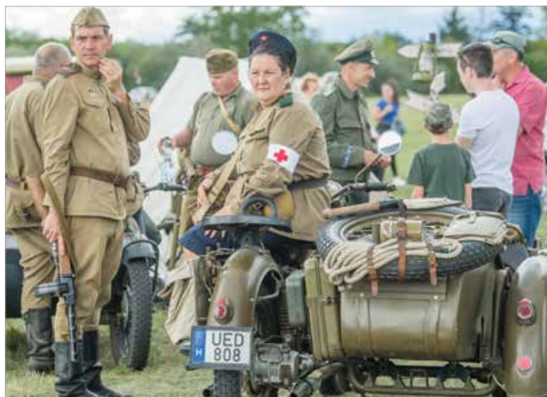
A járművektől az egyenruhákig találkozhattak a látogatók a nem is olyan régi kor katonai jellegzetességeivel