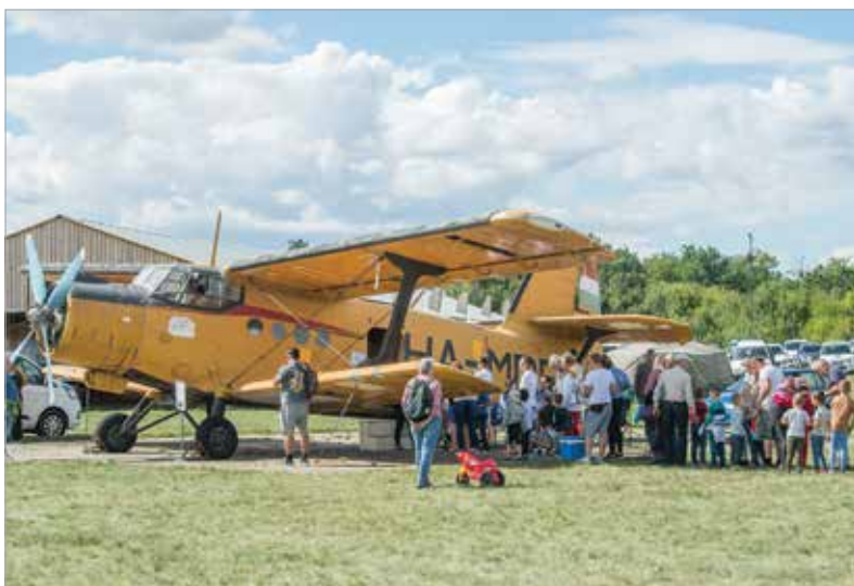
A bemutatók és a sétarepülések keretében folyamatosan rótták a köröket a közönségkedvenc An-2-es és a Li-2-es repülőgépek. Hosszú sorok vártak rá, hogy madártávlatból is megnézhesék Székesfehérvár környékét, kihasználva a repülőnap kínálta lehetőséget.