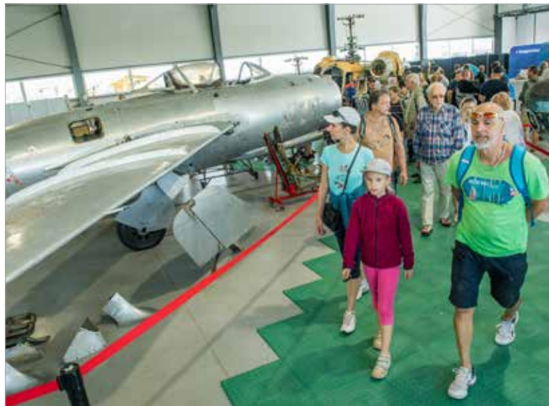
A Börgöndre érkezők számára nemcsak az égen látható show miatt volt emlékezetes a repülőnap