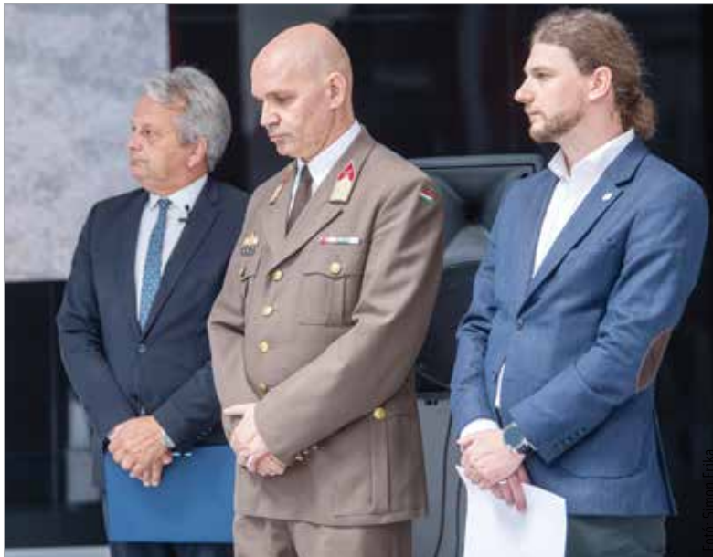
Pénteken jelentették be, hogy jövőre újabb nagyszabású kiállítás nyílik a Szent István Király Múzeumban