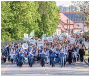
Idén is lesz Sportmajális: a klubok menete a Petőfi-szobortól a Bregyó közti Sportcentrumig halad május elsején

A következő városi rendezvény a május elsejei sportmajális, aminek újra a Bregyó közti Sportcentrum ad helyet. A majálisra jelentkezett negyvenhét sportegyesület tagjai a Petőfi-szobortól a Bregyó közbe menetelnek majd. Több mint kétezer amatőr és profi sportoló vesz részt az eseményen. A klubok ezen a napon bemutatkoznak, az érdeklődők pedig ki is próbálhatják a különböző sportágakat. De lesz akadálypálya, és sorversenyt is tartanak, ahol iskolások és a város sztárjátékosai mérkőzhetnek meg egymással. A Hetedhét Játékfesztivál idén egynapos lesz: május utolsó vasárnapján várják a belvárosba a gyerekeket. Szerveznek koncerteket, utcai játékokat és hétpróbát is. Azon a hétvégén ünnepeljük pünkösödöt, így a gyerekek a