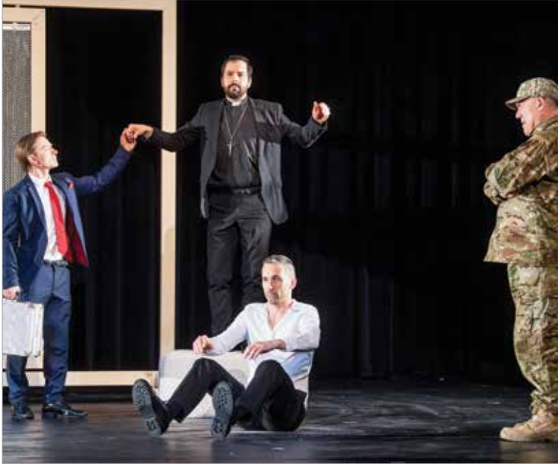
A színműben fontos szerep jut az egyház és a katonaság képviselőjének

Új bemutatóval jelentkezett a Vörösmarty Színház. A jeruzsálemi király új szemszögből láttatja az Aranybulla uralkodójának történetét, kiemelve a szentföldi hadjárat misszióját és II. András viszonyát környezetéhez, illetve hitveséhez, Jolántához.