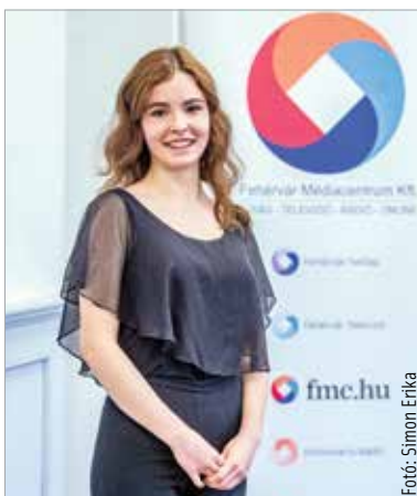
A Fehérvári Versünnep tizenharmadik győztese csak barátnői unszolására jelentkezett a versenyre. Kár lett volna kihagyni!

Most is mások győztek meg, hogy eljőjtek. Mindig is szerelmem volt a színház, de a versmondó versenyek kimaradtak eddig. Barátnőim nyomására döntöttem végül úgy, hogy akkor ezt is kipróbálom az utolsó évben, és egyáltalán nem bántam meg! Nagyon magasak az