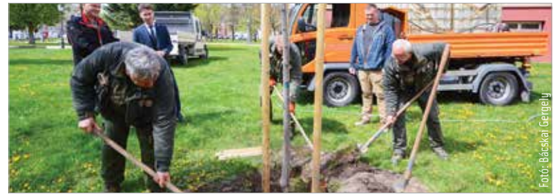
A 2018-ban felújított Jávor Ottó tér különleges szerepet kapott: minden évben egy-egy fát ültetnek el itt az előző esztendőben világra jött fehérvári gyermekek tiszteletére. A Városgondnokság szakemberei idén egy ezüst hársat ültettek el a parkban, mely a mintegy három ezer, 2022-ben Székesfehérváron született gyermek világra jöttét szimbolizálja.