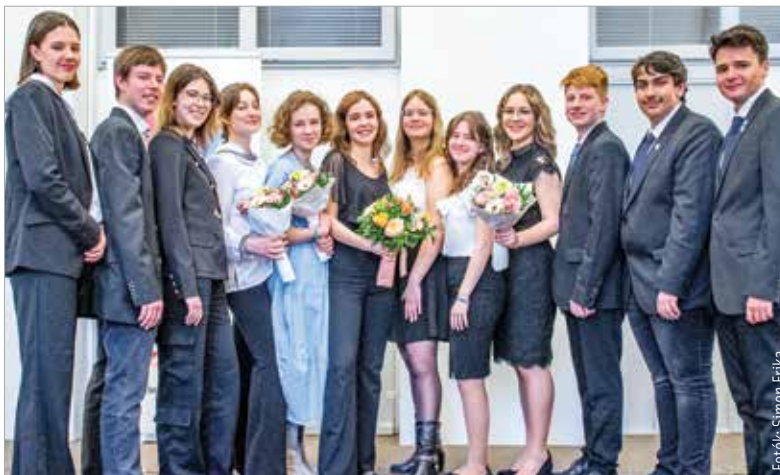
A tizenkét döntős a Versünnep színpadán a Városháza Dísztermében

pel kezdődik. A verseny fiataljai adják az év első, meghatározó közösségi élményét. A Versünnep az évek során mozgalommá vált, köszönhetően a verseny megálmodóinak és támogatóinak” – fogalmazott köszöntőjében Cser-Palkovics András polgármester. Hozzátette: a fiatalok értik a világ kihívásait, van véleményük, szeretik a költészetet,