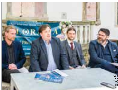
Újdonságokkal jelentkezik április utolsó hétvégéjén a Floralia, a részletekről sajtótájékoztatót számoltak be

A 2015-ben újjáépült táci létesítmény Közép-Európa legnagyobb régészeti parkja, ahol a huszonnyolc hektáros terület közel ötödén mutatják be Gorsium római kori településéig feltárt régészeti emlékeit. A park minden évben egy különleges időutazásra is hívja a vendégeket: a tavasz köszöntő ünnep, a Floralia minden korosztálynak kínál látnivalót. Gorsium hazánk egyik legjelentősebb római kori emléke, mely távol fekszik a mai civilizációtól, így lehetőség nyílik az ókori élet élményszerű, interaktív bemutatására. Róth Péter alpolgármester a Floralia programját ismertető szerdai sajtótájékoztatóján minden fehérvári és város környéki érdeklődőt arra buzdított, látogasson el a rendezvényre: