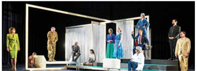
A darab a magyar történelem viharos időszakát felidézve az Aranybulla kihirdetésével Székesfehérváron ér véget