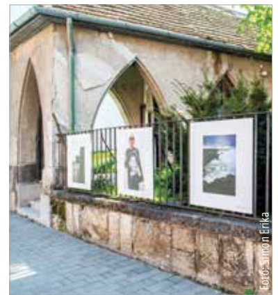
A kortárs festőművészek és fotósok munkáit a Szent István Király Múzeum Országzászló téri épületének Vár körüli és Basa utcai kerítésén láthatjuk

A kurátorok olyan műveket mutatnak be, amelyek reményt keltenek, életerőt, jókedvet, derűt vagy játékos humort sugároznak. Olyan lelki kapaszkodóként szolgáló témákat vetnek fel, mint a természet, a szépség, a család, az emberi kapcsolatok, a földi élvezetek, a földön túli tér, a történelmi és kulturális hagyomány vagy a transzcendencia. Az alkotások kiemelt motívuma a fény, az élet, a szellem és a bizakodás szimbóluma. A festményeket Sturcz János művészettörténész, a Magyar Képzőművészeti Egyetem Művészettörténeti Tanszékének vezetője, a fotókat Hannawati Raden grafikus, társszervező válogatta.