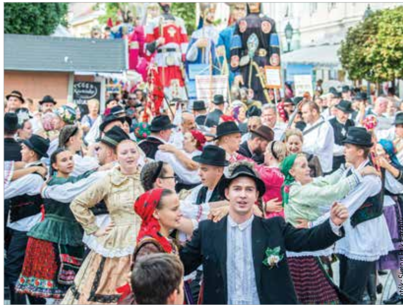
A Királyi Napok színvonalja nem változik, csak néhány nappal kevesebb ideig élvezhetjük

jelentkezni a főzőversenyre! Megtartják a Királyi Napokat is, ami egy héten át tart néptánccal, koronázási ünnepi játékokkal, óriásbábokkal, valamint nagykonzertekkel. Fellép az R-Go és Charlie is.