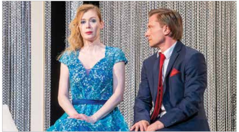
Jolánta királyné és II. András nagy utat tett meg