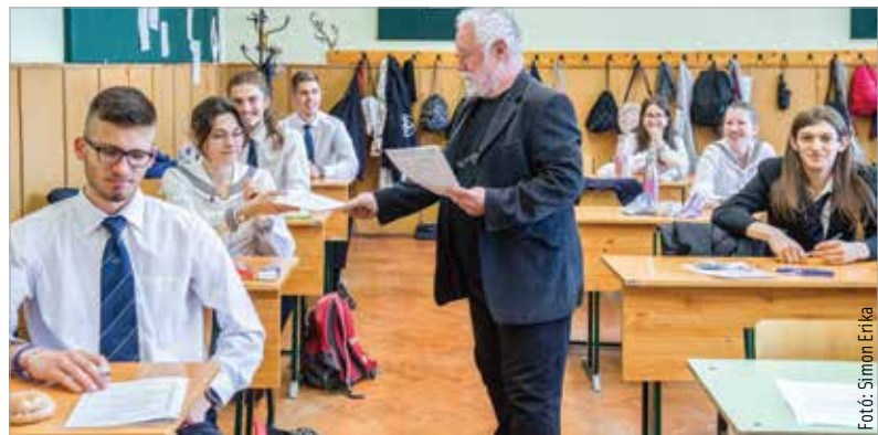
A magyarérettségi feladatlapjait kapják kézhez a ciszterci diákok

A feladatlapon az elmúlt időszak egyik központi témája, az árcsökkenés is előkerült, míg a második részben a diákok a Föld népességéhez köthető százalékszámítással foglalkoztak. Szerdán történelemből középszinten háromórás, emelt szinten négyórás számonkérés várt a fiatalokra. Középszinten az első részben a kereszténységre, a Szovjetunióra, az Európai Unióra, valamint Hunyadi Mátyásra és a Rákóczi-szabadságharcra vonatkozó kérdéseket kaptak a diákok. Az egyetemes esszétémák közül pedig Julius Caesar uralkodásáról vagy az auschwitzzi koncentrációs táborról írhattak az érettségizők. A magyar történelmi témák között pedig Széchenyi István gyakorlati tevékenységét vagy a magyar rendszerváltást választhatták.