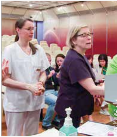
A kézhigiéné maraton igazi nyertesei a betegek, hiszen a tesztek során kiderült, hogy a kórházi dolgozók higiénés szaktudása megfelelő

A kórház Romhányi-auditóriumában várták a munkatársakat múlt héten szombaton, akik az alapos fertőtlenítést követően szkenneres vizsgálatnak vetették alá magukat. A berendezésnek köszönhetően másodpercek alatt kiderült, ki, milyen alapos volt, majd elméletben, egy teszt kitöltésével is bizonyítaniuk kellett a résztvevőknek a higiénés tudásukat. Végül sorsolás útján dőlt el, hogy a legjobban teljesítő csapatok közül az Ápolási Osztály munkatársai győzedelmeskedtek, ők nyerték meg a fődíjat, egy tortát.