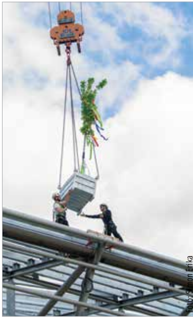
Bokrétaünnepség az Alba Arénában: elérte legmagasabb pontját a csarnok épülete