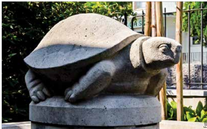
A kis teknős kiváló állapotban várja a szeptemberben érkező ovisokat