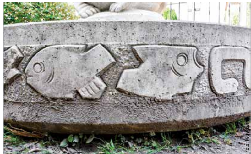
A kutat több állatfigura is díszíti

Corridoniai Kiállítás aranyérme; 1985 – az Urbinói Egyetem ezüst serlege; 1986 – az Európa Parlament elnökének díja. Olaszországban és Franciaországban is rendszeresen szerepelt kiállításokon és tanulmányutakon. Nagy Kovács Mária kilencvenöt éves korában, 2005-ben hunyt el. Gazdag szakmai hagyatékában a köztéri alkotások kisebb szeptet foglalnak el, Budapesten és Tata-bánya környékén három-három alkotása található, a legkedvesebb szobra azonban Székesfehérváron maradt fenn. A Teknősbéka 1960-ban készült el és kapott helyet a Belvárosi Brunszvik Terező Óvoda kertjében. Nem csupán egy állatfigurát formázó