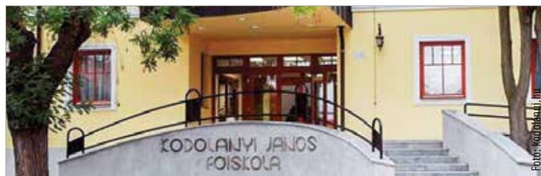
Tíz év után ismét lesz kommunikáció és médiatudomány szak Székesfehérváron