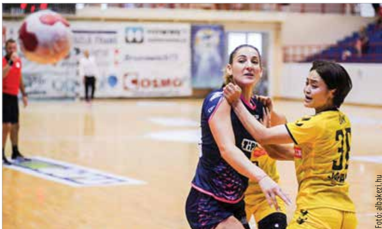
Harcias japánokkal találkozott a zármeccsen a fehérvári kézisek