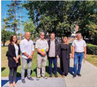
A zsűrizések a hónap végén befejeződnek, a verseny díjátadója októberben lesz

Városunk ismét megméretteti magát: Székesfehérvár idén is részt vesz a Virágos Magyarországért környezetcsépítő versenyen. A zsűrizés már zajlik, a szakemberek múlt héten csütörtökön elsőként a Vörösmarty tér újonnan telepített parkját tekintették meg, ahol már kezdenek összenőni az évelő növények a virág-