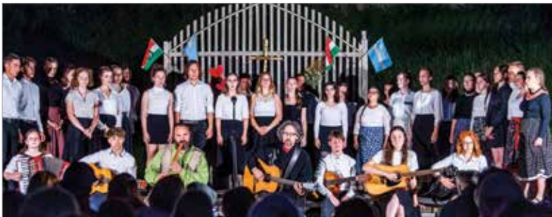
Nagy sikert aratott a Vershúron-gála