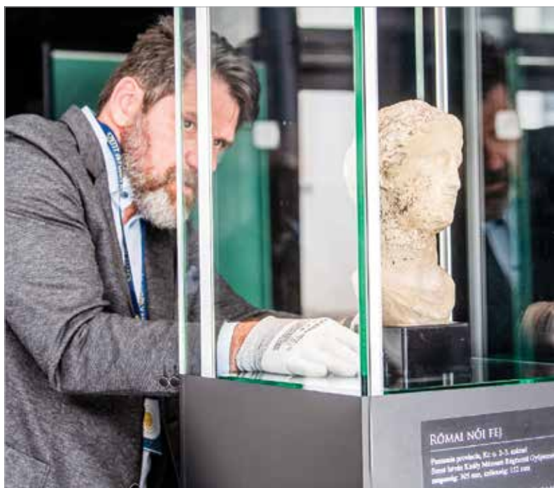
A szobor a 2-3. századi Pannóniából származhat

műtárgyat, s szándékaik szerint a jövőben is így tesznek majd, ha a költségvetés engedi.