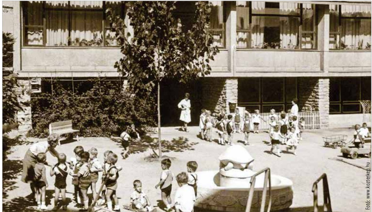
Úgy tűnik, már a felállítás utáni években sem használták kútként