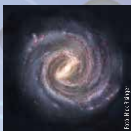
2023. aug. 3-9.

A visszafogott külső alatt erős érzékiség lappang, mely arra vár, hogy szabad utat kapjon. Olyan partner társaságában tudsz kibontakozni, aki megértéssel fogad, és kezelni tudja a hangulatváltozásaidat.