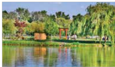
A Csónakázó-tó környéke is megújult, japánkertet alakítottak ki a szigeten

Székesfehérvár zöldterületeivel tavaly nemzetközi versenyt nyert városunk: a legjobb, arany minősítést és különdíjat is kapott az Entente Florale Europe 2022-es virágosítási versenyen.