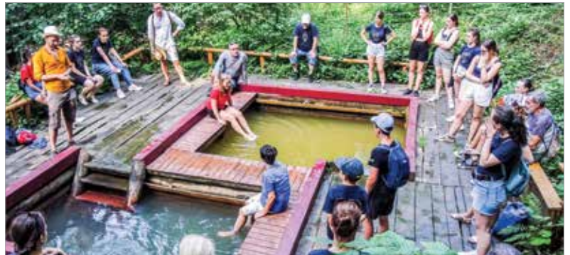
Jutott idő a kapcsolódásra is