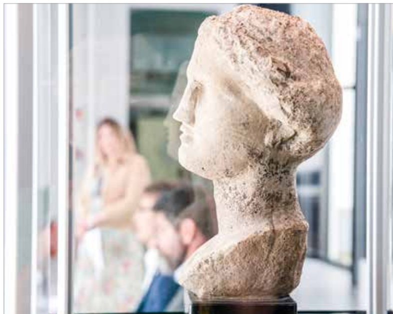
A 305 milliméter magas és 152 milliméter széles Vénusz-fej restaurálás előtti állapotában augusztus végéig a rendházépület látogatóközpontjában tekinthető meg