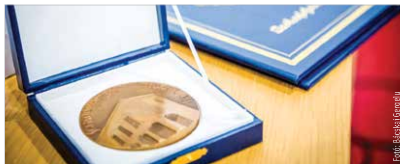
Bárki javaskatot tehet augusztus huszonegyedikéig

Az elismerések adományozására bármely természetes vagy jogi személy javaslatot tehet. A javaslatnak tartalmaznia kell a javaslattevő nevét, a díj megnevezését, valamint a javasolt személy vagy közösség nevét és részletes méltatását. A javaslatokat zárt borítékban kell eljuttatni a Polgármesteri Hivatal portáira vagy postai úton az alábbi címre: Székesfehérvár Megyei Jogú Város Polgármesteri Hivatala, Közművelődési és Civilkapcsolatok Irodája, 8000 Székesfehérvár, Városház tér 1.