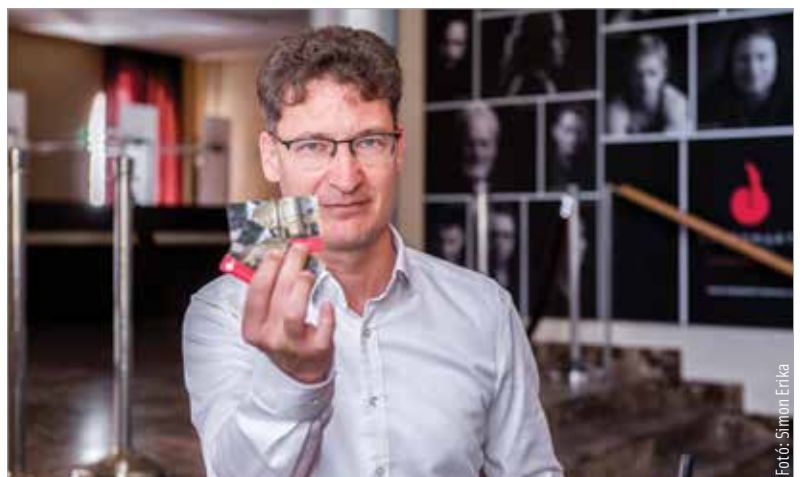
A polgármester kiemelte, hogy továbbra is lesz lehetőség a Városháza Dísztermében megnézni a Tizenkét dühös embert, ami kuriózum volt a tavalyi évadban

drágám!, valamint A Kőszívű ember fiai is. Továbbra is láthatja a közönség a Mágns Miskát, a Boeing, Boeinget, a Padlást, a Beatles.hu-t, a Fame-et, Az öreg hölgy látogatását, a Diótörőcskét, a Tizenkét dühös embert, a Petőfi rockot és A cégvezetőt is. A Vörösmarty Színház huszonhárom fajta bérletkonstrukcióval várja a színházbarátokat. Cser-Palkovics András polgármester – miután megvette bérletét – elmondta: bízik benne, hogy egy szép, zavartalan és teljes évadot lehet megkezdni a Vörösmarty Színházban.