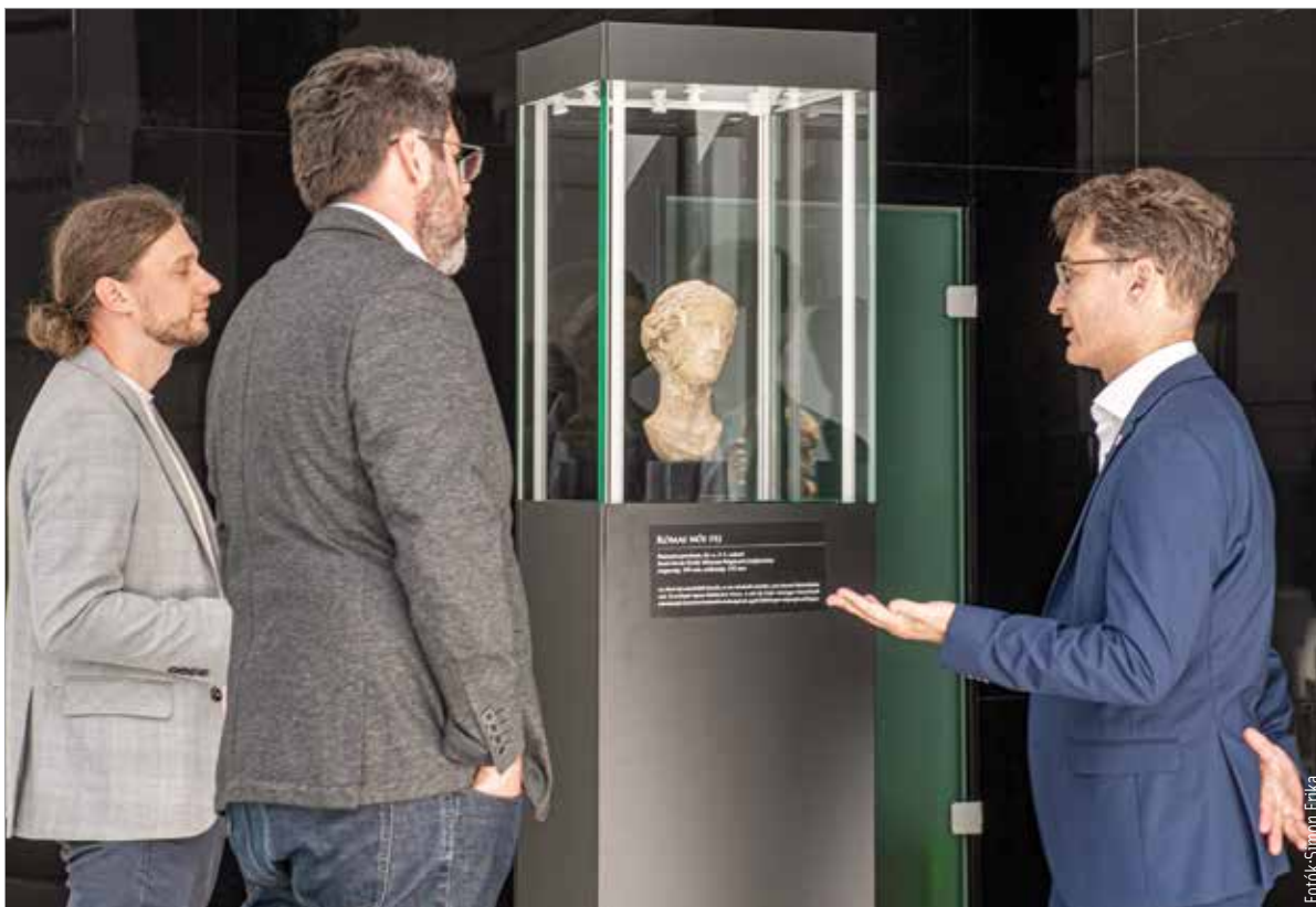
Különleges műalkotást sikerült megvásárolnia a múzeumnak

A szobor a Krisztus utáni 2-3. századból származik. A szakemberek figyelmét egy árverési katalógusban leírtak kellették fel, ugyanis a császárkori Vénusz-szobor hazánkhoz, azon belül Székesfehérvárhoz kötődhet. „Származási helyként Székesfehérvár került meghatározásra, így most hazatért a szobor. Egy aukción sikerült megvásárolnia a Szent István Király Múzeumnak” – mondta el lapunknak Cser-Palkovics András. A polgármester a hétfői sajtótájékoztatóról is beszélt, hogy amint fény derült a szobor léte, a város azonnal megpróbálta „hazahozni” a 2-3. századi műtárgyat. A következő egy hónapban a múzeum látogatóközpontjában közszemlére teszik a szobrot, hogy bárki megtekinthesse. Mint kiemelte, ez volt az első alkalom, amikor aukción vásároltak