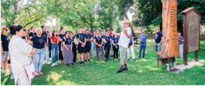
A táborozók idén Petőfi nyomába indultak

Véget ért az idei csikcsomortáni Verstábor. A Fehérvári Versünnepek döntősei, valamint határon túli magyar fiatalok egy héten át élvezhették az erdélyi táj szépségét és a helyiek vendégszeretét, miközben szellemi épülésükről számos kiváló művész gondoskodott. A tábor azonban a tanulás, a fejlődés mellett hétköznapiabb élményekkel is szolgált.