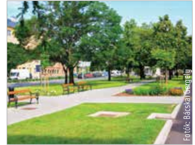
A Vörösmarty téren a korábbi murvás sétányok helyett térköves járdát építettek, és fenntartható virágágyásokat, illetve zöld szigeteket alakítottak ki

sek a településeken, és várhatóan októberben lesz a verseny díjátadója.