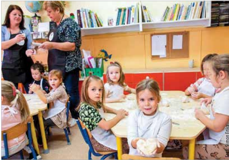
Biztosított lesz a normál és a diétás étkezés, és azok ára sem változik