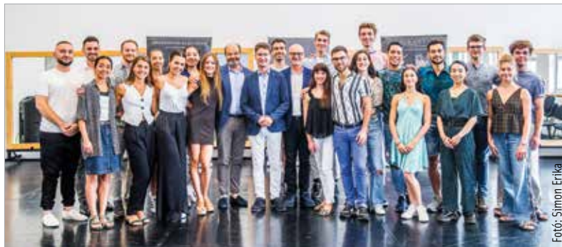
Az ötéves társulat új művészeti ágat honosított meg Székesfehérváron

A balettszínház méltó módon tervezi megünnepelni fennállásának ötödik évfordulóját: a Királyi Napokon mutatják be Parádé című produkciójukat, valamint a rendezvény ideje alatt jelmezkiállítást is terveznek, melyben együttműködő partnerük a Szent István Király Múzeum.