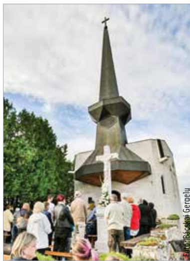
Az épület 2008-ban Építőipari Nívódíjat kapott

Sokan vettek részt vasárnap a búcsún, melyen Spányi Antal celebrált szentmisét Székesfehérvár legmagasabb pontján. Az öreghegyiek 1733-ban emelt kápolnáját – a helyi szőlőműves polgárság kérésére – Szent Donátról nevezték el, így augusztus első vasárnapján a kápolna névadója napját ünnepelték a hívek. A püspök arról beszélt, hogy Jézus a hegyre viszi az apostolokat, így az ember, amikor a hegyre megy, ugyanúgy Istennel találkozik, akár csak Mózes vagy Illés. A Szent Donát-kápolna új épületét 1994. augusztus 7-én Takács Nándor székesfehérvári megyés püspök