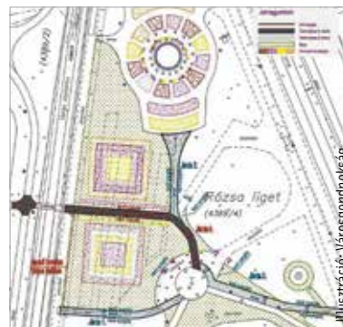
A Rózsaliget várhatóan még ebben az évben megújul