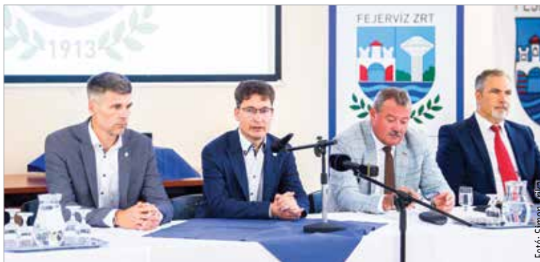
Múlt pénteken aláírták a szerződést: a Fejérvíz minden ingatlana és infrastruktúraeleme az államhoz került

„Látszott, hogy olyan kihívások vannak a Fejérvíz Zrt. előtt, amiket a Fe-