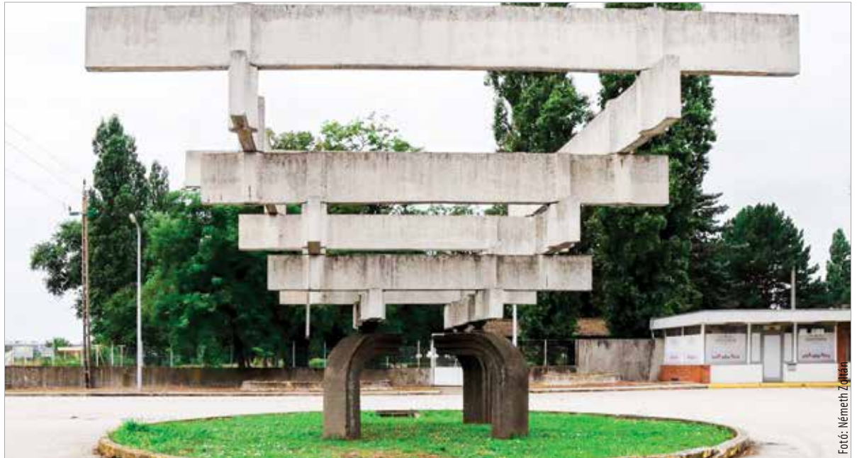
Az alkotás az AREV egykori tevékenységi körére utal

Egy másik hasonló alkotás az Alba Ipari Zónában, a Karsai Holding telephelyének udvarán található. A Kör Három Dimenzióban névre keresztelt alkotás Fajó