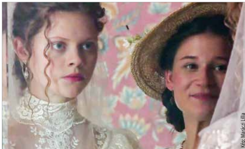
A Majdnem menyasszony című hetvenperces filmet idén karácsonykor láthatják a nézők a Duna Televízióban

A produkciót Pacskovszky József rendezte. Huszonkét napig forgattak négy helyszínen, több mint harminc szereplővel és háromszáz statisztával.