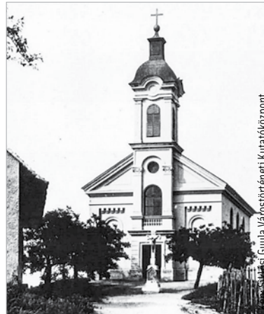
1945-ben a lőszerraktárnak használt kápolna felrobbant, és teljesen megsemmisült

nek el, és ezzel a szórakozó embereket mind az erődítmény alá hívják.” Siklósi Gyula kutatásai szerint Kara Murteza az általa építtetett tornyot ovális alakú földvárral és árokkal vette körül, de a közepén elhelyezkedő torony Evlia Cselebi leírásával ellentétben nem kerek volt, hanem inkább elfektetett hordóra emlékeztető alaprajzzal rendelkezett. Az erődítmény Isztolni Belgrád egyik fontos elővára volt, mely