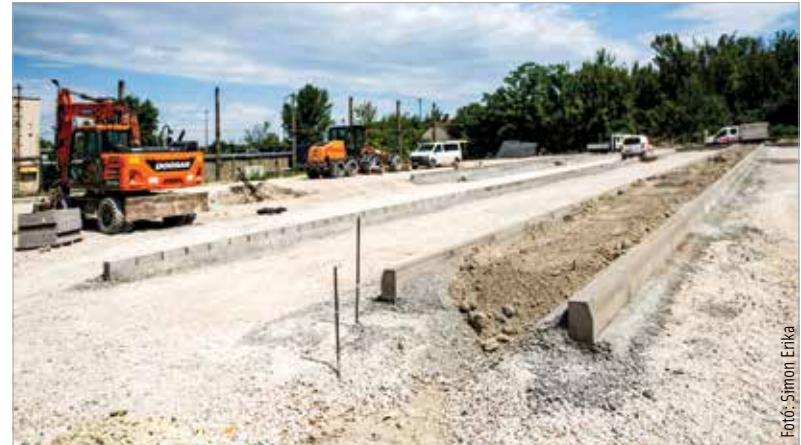
A vasútállomás déli oldalán száznegyvenkilenc normál és három mozgáskorlátozottak részére kialakított P+R parkoló létesül, emellett száz kerékpár elhelyezésére alkalmas tároló is épül

A fejlesztés részeként a Déli vasút utcát teljes hosszában átépítik, hogy könnyen lehessen megközelíteni a parkolót. Az akadálymentes közlekedés segítésére két lift létesül a gyalogos-felüljáró egy-egy oldalán. A liftek tizenhárom személyt tudnak majd szállítani. A parkolókat és a lifteket várhatóan az év végén veheti használatba az utazóközönség.