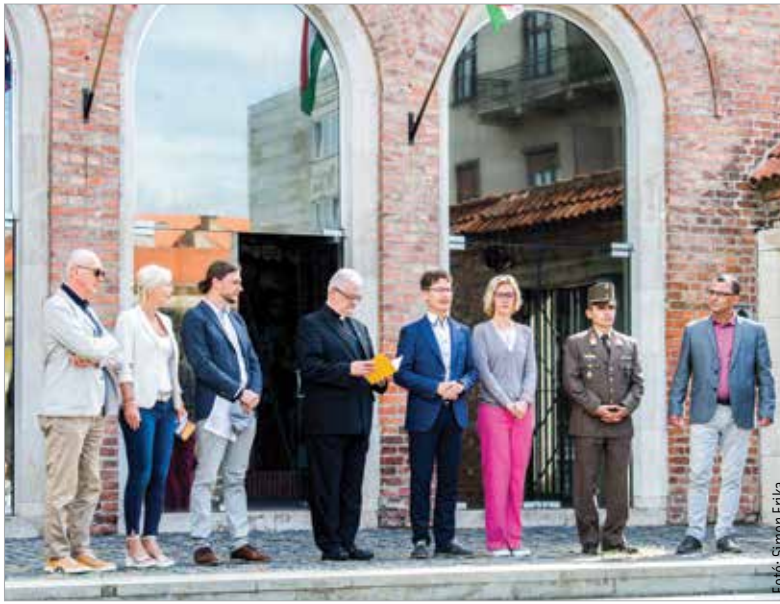
A szervezők színes programokat ígérnek az előttünk álló ünnepi napokra

„A cél az, hogy induljunk ki a város történelméből, és a kulturális programok keretében ehhez kapcsolódó