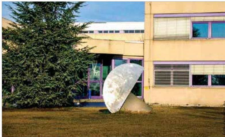
A Kör Három Dimenzióban című Fajó-szobor a Karsai Holding telephelyén áll

János orosházi festőművész ötlete alapján készült, és 2001-ben került a műanyag-feldolgozó vállalat telephelyére.