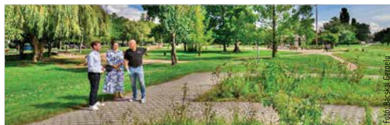
A három forgalmas sétányt térkövel burkolják