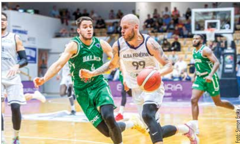
Vojvoda Dávidék ezúttal hazai pályán szenvedtek vereséget a FIBA-Európa-kupában

Itt sikerült folytatni a jó bajnoki sorozatot, negyedszer is győzött a csapat, amivel immár egyedül veretlen a magyar mezőnyben, és az első helyen áll a táblázaton. Chambers a pontokért, Dickey a lepattanókért felelt, és a hajrát ideigleg is jobban bírta az Alba. Ezek után szerda este újra a FIBA-Európa-kupában volt jelenés, mégpedig hazai pályán. A bolgár Botevgradal évekkkel ezelőtt már találkozott az Alba, akkor itthon legyőzte. Ezúttal azonban nem sikerült megismételni az akkori teljesítményt: a bolgárok domináltak a mérkőzést, és 88-78 arányban diadalmaskodtak.