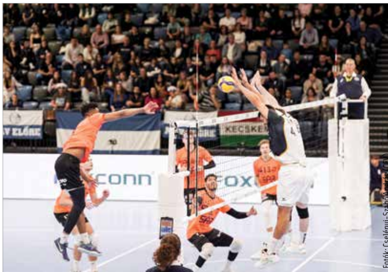
A fehér mezű MÁV Előre jó sáncmunkája is kellett a magabiztos győzelemhez

engedte ki a kezéből a szettet, így 3:0-s győzelemmel mutatkozott be az európai kupaporondon.