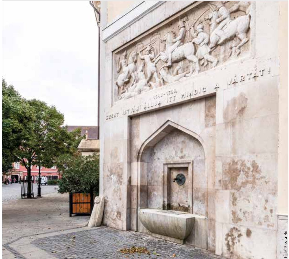
A Törökkút nyolcvanöt éve része a belvárosi utcaképnek

Az 1938-as év, Szent István királyunk halálának kilencszázadik évfordulója nagyszabású ünnepségsorozattal vált emlékezetessé. Az emlékév központja Székesfehérvár volt: az Országgyűlés 1938. augusztus 18-án kihelyezett ülésén államalapító királyunk halálának kilencszázadik évfordulója alkalmából emelte állami ünnep rangjára Szent István napját. Ezen jeles alkalom mellett számos más ünnepi esemény is történt, például több alkotást, köztéren felállított művet avattak fel. Ezek között volt a Törökkút, mely kakukktójas a többi alkotás között. 1938 ugyanis duplán ünnepi év volt: erre az esztendőre esett a török hódoltság alól felszabadulás kétszázötvenedik évfordulója. Az alkotás főleg az utóbbi esemény apropóján készült, de elhelyezték rajta olyan utalásokat, melyek államalapító királyunk halálának évfordulójához kapcsolódnak. Az eltelt nyolcvanöt évben generációk sokasága oltotta szomját a mai Városház tér kútjának vizéből, sétált el mellette az őszi vagy tavaszi napsütésben. Ugyanakkor valószínűleg kevesen tudják öszszekötni alkotója révén egy másik, nem is oly messze elhelyezkedő alkotással, Székesfehérvár kecses táncosnőjével. A Kossuth utca, a Táncsics utca és a Hősök tere találkozásánál elhelyezkedő szobor alkotója az a Medgyessy Ferenc, akinek nevéhez a Törökkút is kapcsolódik. Az 1881. január 10-én született Kossuth-díjas szobrászművész 1958-ban bekövetkezett haláláig több mint száz köztéri alkotást készített.