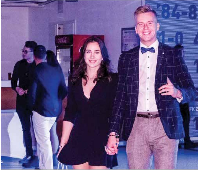
Közel ötszáz elsőéves hallgatót köszönhetünk városunkban

Négy év után újra összegytemi gólyabált rendeztek a székesfehérvári egyetemistáknak. Kedd este a Sóstói Stadion rendezvénytermében az Óbudai Egyetem Alba Regia Műszaki Kara és a Kodolányi János Egyetem hallgatói bálkirálynőt és bálkirályt választottak, majd Metzker Viktória zenéire buliztak.