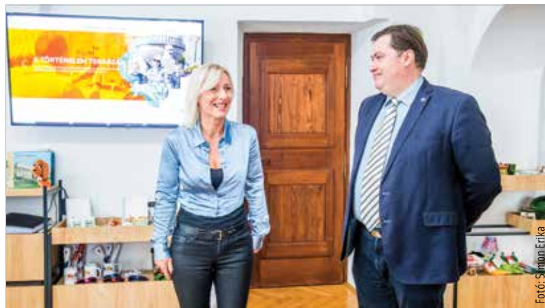
A Tourinform Iroda ismét sikeres évet zár

A 2023-as év újdonságokat is hozott a Tourinform Iroda számára: a nemrég indított Királytúrák elnevezésű program nagy népszerűségnek örvend, melynek során az óriásbábokat lehet megtekinteni a fűtőerőműben.