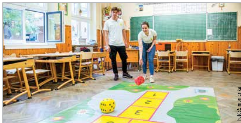
A program célja a játékos tanulás

Az Egy Csepp Alapítvány öt éve hozta létre az Egy nap Cukkerbergben elnevezésű játékot, melynek célja, hogy a gyerekek egy tematikus nap formájában, játékos módon sajátítsák el a cukorbetegséggel kapcsolatos legfontosabb tudnivalókat. A nap folyamán a gyerekek kvízzjátékban is részt vehettek, de voltak ügyességi feladatok és eszközbemutató is. A legügyesebbek meglepetéssel mehettek haza a nap végén.