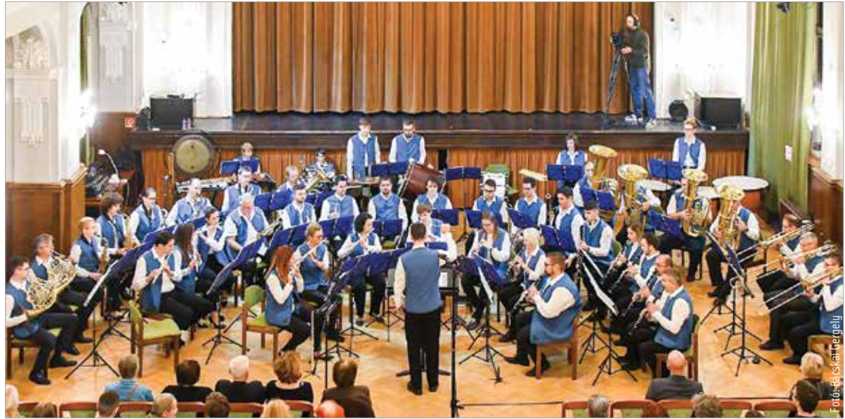
Az ünnepi koncertről készült felvétel megtekinthető a Fehérvár Televízióban november huszonhatodikán 19.20-kor!

„Nagyon sok szép élményünk volt ennyi idő alatt, igazi közösség lettünk. Már több száz ember megfordult a zenekarban, de vagyunk páran még alapítótagok. Nagyon jó barátságok alakultak és alakulnak ki a mai napig. Jártunk mindenfelé a világban, nagyon szeretünk együtt