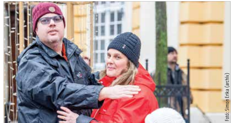
Az ölelés az épek és a fogyatékkal élők egységét szimbolizálja