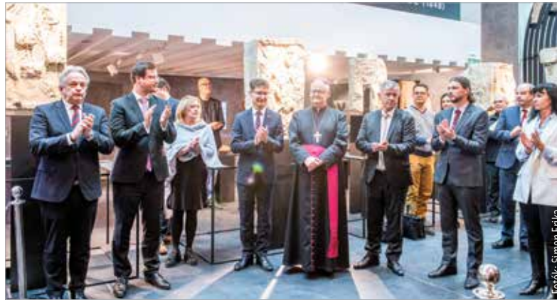
Ünnepélyes keretek között nyitotta meg kapuját a Koronázobazilika Nemzeti Emlék hely Látogatóközpont

További információk a nyitvatartásról és minden fontos tudnivalóról: www.solium.regni.hu , illetve www.szikm.hu .