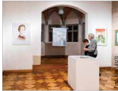
Petőfi élete, munkássága és kora ihlette a kiállításon látható műveket

A mai Magyarország területén belül Székesfehérvár ad elsőként helyet ennek a szép és elgondolkodtató kiállításnak. Büszkeség, hogy a szervezők is úgy érezték: a nemzet egykori fővárosában helye van ennek a tárlatnak – mondta köszöntőjében Cser-Palkovics András polgármester. Székesfehérvár őrzi Petőfi emlékét: ott, azon a helyen, ahol egykor maga is fellépett, a ma fiataljai vitték színre a Vörösmarty Színház produkciója keretében a Petőfi rock című musicalt az emlékévé eseményeként. A