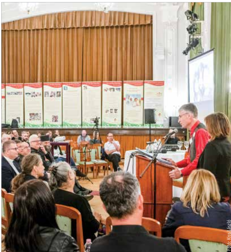
Közös ima, beszélgetések, tanúságtétel is volt a Szent István Hitoktatási és Művelődési Házban

hogyan kell hozzáállni az élethez, az élet szolgálatához, az élet elfogadásához, az élet felneveléséhez. Ezekben a kérdésekben, ahol bizonytalanságok vannak, mert sokféle vélemény hangzik egyforma erővel a világban, azt érezzük, fontos, hogy a Katolikus Egyház álláspontja is elhangozzék megfelelő erővel, megfelelő súllyal.” A nap folyamán a természetes fogantatástól a természetes halálig többféle témában tájékozódhattak a résztvevők. Szóba került a családtervezés, az abortusz, az örökbefogadás, a nevelőszülőség, a lelki örökbefogadás, a közösség megtartó ereje és az időskor. A rendezvényen standokon keresztül mutatkoztak be az életvédelem területén dolgozó szakemberek, közösségek, szervezetek.