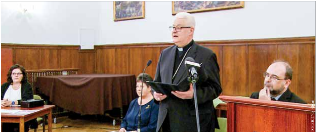
Spányi Antal megyés püspök méltatta a kötetet és a néhai szerző téma iránti elkötelezettségét

Spányi Antal megyés püspök szerint a székesfehérváriak számára is fontos, hogy megtalálják azokat a hitbéli tájékozódási pontokat, amelyek hozzájárulnak a teljes élethez: „Ahhoz, hogy az ember saját lakókörnyezetében igazán otthon érezze magát, szüksége van olyan tájékozódási pontokra, amelyekhez személyes érzelmekkel, emlékein keresztül tud kötődni. Ha ezek nem is