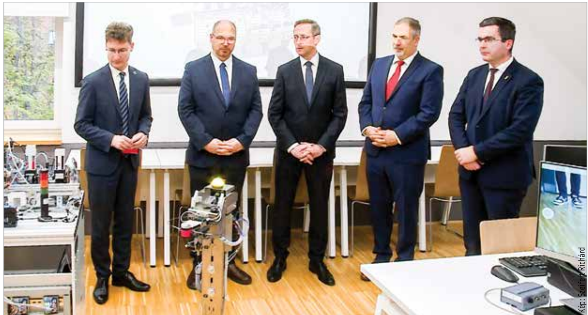
Az új laborok hozzájárulnak ahhoz, hogy a hallgatókat a legmodernebb technológiák segítségével képezzék, és versenyképes tudást kapjanak

Székesfehérvár polgármestere az ünnepélyes átadáson hangsúlyozta: az ipar rohamos változáson megy keresztül, ezért a szakmunkást, de a mérnököt is erre a világra kell felkészíteni, ez pedig nem megy együttműködés nélkül. Az egyetem, a vállalati és az állami támogatás és a helyi önkormányzat által biztosítható környezet együttműködéséről szól a