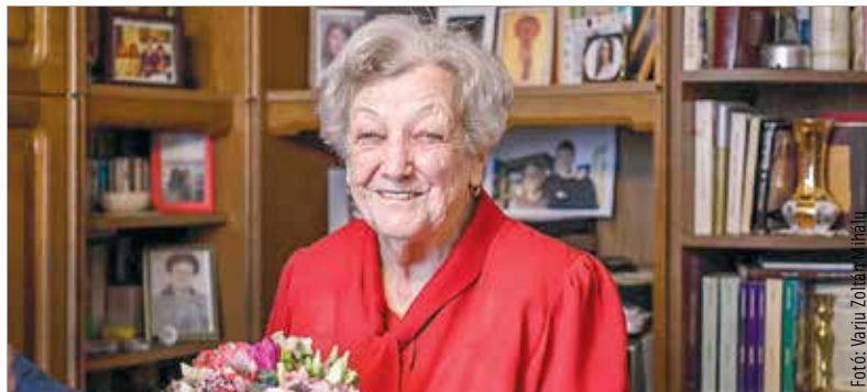
A sors hét saját unokával ajándékozta meg őket, és van egy fogadott unokájuk is

kezdeni. Juló néni közgazdasági, pénzügyi tanulmányokat végzett, egész életében a banki szektorban dolgozott. Megbecsült helye volt, foglalkozott többek között lakás-célú, ipari célú beruházásokkal, közműberuházásokkal, és harminchét év után ment nyugdíjba. A férjével 1958-ban házasodtak össze. Két fiuk született. Nagyon sokat utaztak, imádták sátorozni. Megismerték Magyarország szinte minden szegletét és a világ harminc országát.