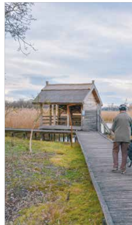
A Sóstó kiránduló- és szórakozóhely is egyben, de

Valóban. Ne feledjük, hogy a nádvágás mellett korábban a vadászat is jellemezte a tavat. A fekete szárcsák időnként ellepték, a rozsdaszínű gácsér és a bűvár,