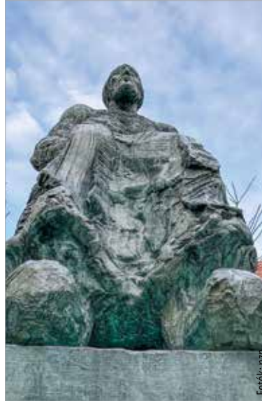
A nagyfejedelem szobra azon a helyen áll, ahol a feltételezések szerint eltemették. Sajnos az évszázadok szétzúzták vagy elfedtek nagyon sok nyomot, de a leírások alapján Géza csontjainak itt kell lenniük!

Géza Árpád vezér dédunokájaként, Zolta unokájaként, Taksony vezér fiaként látta meg a napvilágot 945-ben. Édesanyja a besenyő (más források szerint kun) törzsfő, Tonuzoba lánya volt, aki nem Gézaként szólította gyermekét, hanem Gyeücsa, esetleg Gyécsa néven. Taksony halála után Géza ült a fejedelmi trónra, ami az Árpád-házi uralkodási szabályoknak némiképp ellentmondott, ugyanis Árpád halála után Taksony lett a fejedelem, amely hatalom Tarkacsura, a legidősebb fiúra kellett volna, hogy átszálljon. Így a jogkörok öröklődését nagy valószínűséggel Taksony rúgta fel először. Így következhetett a hatalmi rangsorban Géza, aki ebben az időben huszonhét éves lehetett, de tudjuk, hogy