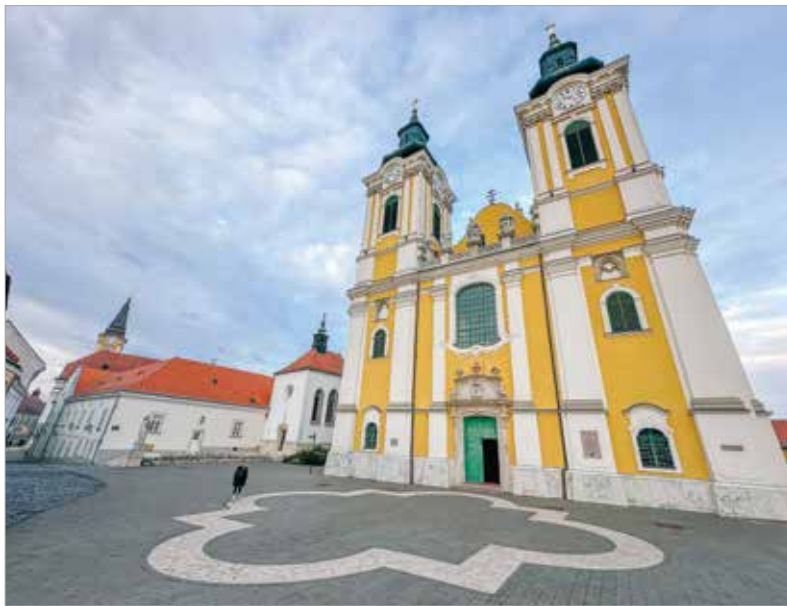
A székesegyház előtti téren a burkolattal kirajzolták a korábban feltárt palotakápolna négykaréjos alaprajzát, de sajnos a hozzá tartozó épületet, amit szintén feltártak, már nem mutatták meg