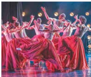
Az előadás február harmadikán este héttől látható a fehérvári teátrumban

A Tűzmadár a lélekben zajló, a jó és a rossz közötti örök párharcot jeleníti meg. A rendező-koreográfus egy szürke, diktatórikus társadalmi világképet mutat be, amelyben a tűzmadár karaktere az emberi lélek szimbólumaként