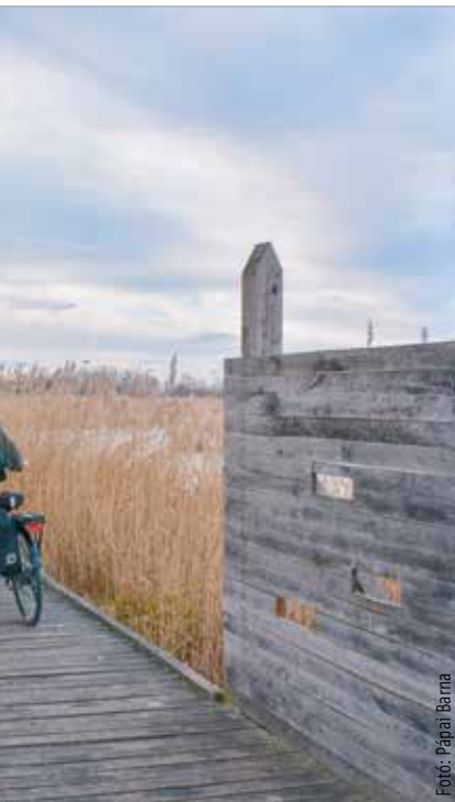
...van, akinek a munkahelyéhez vezető ösvény

Február ötödike Ágota napja, ami sok helyen a sürgés-forgás napja, bár ennél azért egy kicsit több. Ugyanis ezen a napon alaposan körül kell söpörni a teljes lakóházat, de az állatok lakta ólakat, jászlakat és egyéb lakokat is. Ha a gazdasszony nem végzi el ezt a söpörést kellő lélekkel és alaposan, akkor bizony a férgek életre kelnek! Ez a nap ugyanis a férgek eltávolításának napja. A délen élő magyarok körében az az időjárás-i regula is járja, hogy „Ágota még szorítja, de Dorottya majd tágtítja”.