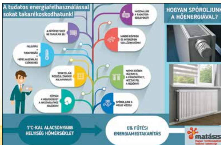
A fűtőtestre lelógó függöny, a ráhelyezett tárgyak, a radiátor közelében elhelyezkedő bútorok akadályozzák a levegő áramlását

A radiátorszelep működése egyszerű: jobbra fordításával (zárásával) alacsonyabb, míg balra csavarásával (nyitásával) magasabb hőmérséklet állítható be. Ha valaki túl melegnek érzi a lakást, állítsa alacsonyabb fokozatra a radiátorszelepet! A termosztatikus szelep automatikusan elzárja a fűtővíz útját. Amennyiben ugyanezen állásban a szoba hőmérséklete a beállított érték alá csökken, a szelep újra kinyit, és a radiátor felmelegszik. A fűtőtestre lógó függöny, a ráhelyezett tárgyak, a radiátor közelében elhelyezkedő bútorok akadályozzák a helyiségben cirkuláló levegő