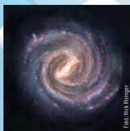
2025. jan. 30. - feb. 5.

A szakosodásnál is jobban emelkedhetsz. Jól kommunikálsz, diplomatikusan fogalmazol, ezért ha most mély társaságba, akkor beragyogod az estét. Ez egyedülállóként különösen előnyödre válhat, de ha párkapcsolatban élsz, párod csodálatát is kivívhatod vele.