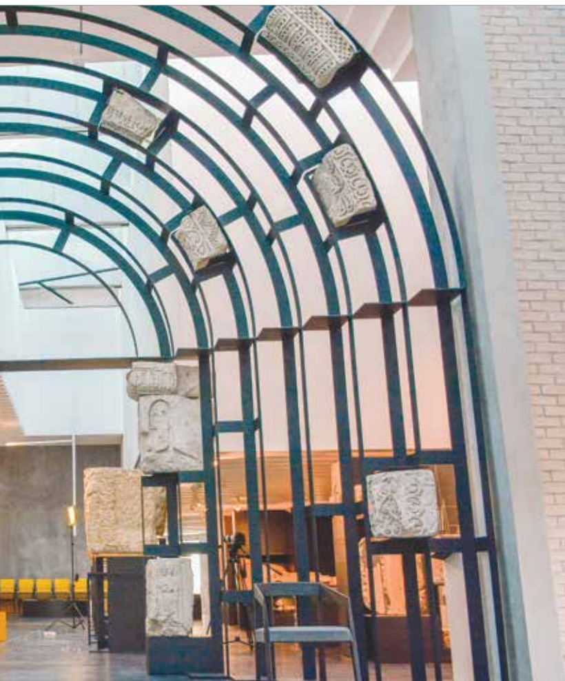
Emlékhely Látogatóközpontjának bejárata

Bár sokszor úgy tűnik, mintha sötétben tapogatóznánk, amikor a korai Fehérvár falairól van szó, de Reich Szabina régész interjúnkban elárulta azt is, hogy milyen módszerekkel válogatják szét az egyes falszakaszokat. Megtudhatjuk azt is, hogyan lehet kutatni egy aktív, élő városban, ahol az ásások bizony megzavarják a jelenlegi életet. Mindezt önök is meghallgathatják a Vörösmarty Rádió műsorában, illetve az fmc.hu oldalon!