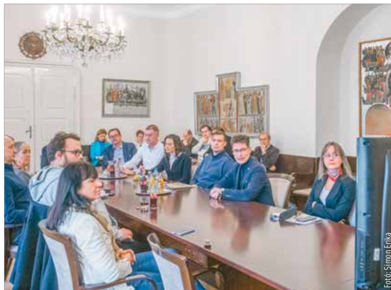
A polgármester arról tájékoztattott, hogy a hosszas előkészítést követően határidőre elkészül az előterjesztés

ciklusban több új képviselő is a testület tagja lett, akik ezúttal első ízben kaptak tájékoztatást a tervezés összetett munkafolyamatáról. A büdzsé várhatóan több mint kilencvenmilliárd forintos bevételi-kiadási főösszeggel számol. Az idei évben is biztosított lesz a város stabil, biztonságos, kiegyensúlyozott működtetése. A tervezet tartalmazza a folyamatban lévő fejlesztések továbbvitelét és új fejlesztések indítását, emellett jelentős összegekkel számol a bérek és a béren kívüli juttatások emelésére az önkormányzati intézményekben és vállalatoknál.