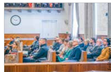
A tervek szerint a jövőben rendszeresen egyeztetnek majd a város kulturális életének meghatározó szereplői