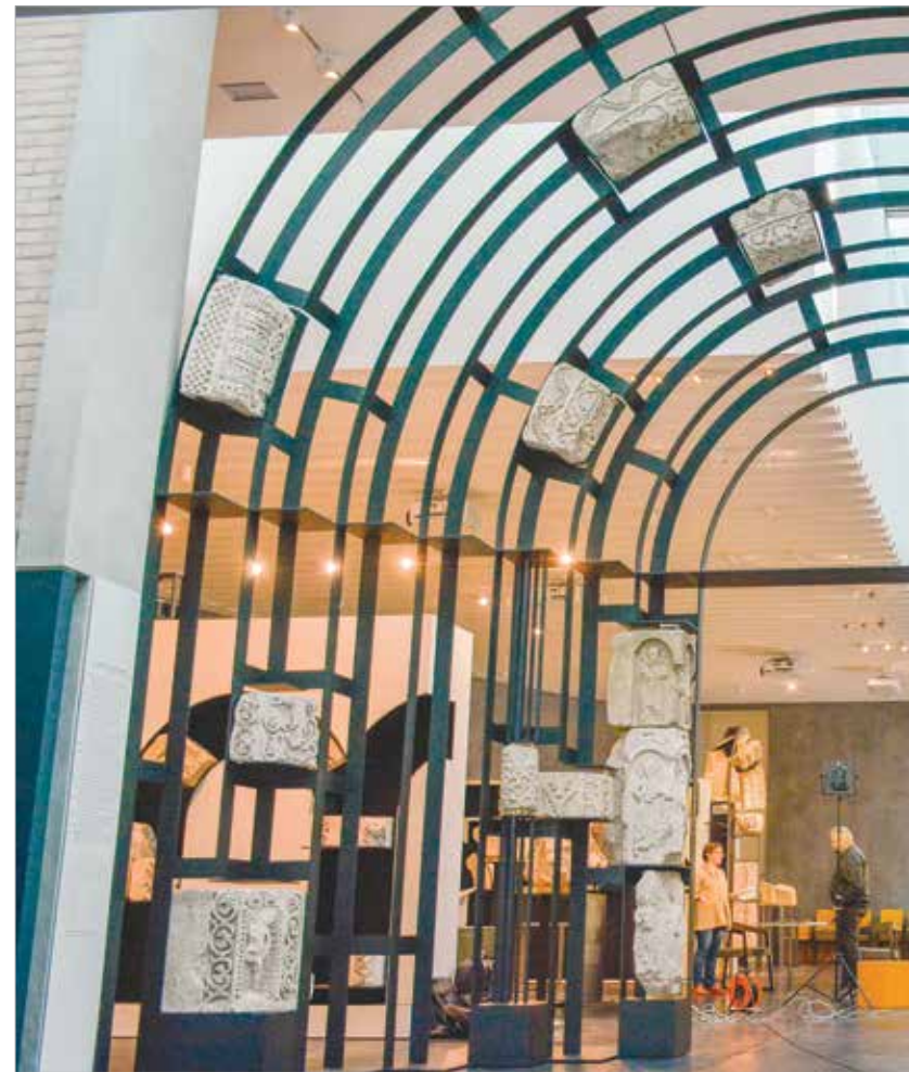
Az egykori koronázótemplom épületének gigantikus kapuját idézi meg a Koronázóbazilika Nemzeti

re utaló jeleket. Bár igaz, hogy a kis murvás parkolóban pár éve kollégáim egy avar kori temetőt mutattak ki, ami azt is jelzi, hogy Fehérvár és térsége már korábban is fontos csomóponti térség lehetett. A belvárosra vonatkozóan még nem rendelkezünk olyan régészeti leletekkel, amelyek a 9–10. századhoz köthetők. A jelenlegi püspöki bazilika környékén viszont sikerült korai Árpád-kori emlékeket találni, de ezek pontos korszakolása még mindig folyamatban van. Mivel a temetők egy templom környezetében kerültek kialakításra, az adott temető egyes sírjainak korszakolását csak a temető kialakításának kezdetével – amit általában a templom megépítésének ideje határoz meg – indíthatjuk, egészen az utolsó temetések idejéig. Nyilván előfordulhatnak speciális kegytárgyak, mint például a gyűrűk, amelyek stílusjegyei megmutathatják a létrehozásának korát. Az Árpád-kori