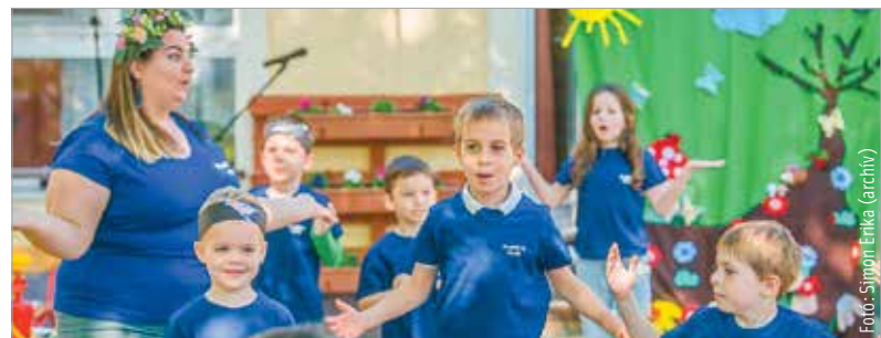
Azokat a gyerekeket kell beírni, akik augusztus végéig betöltik a harmadik életévüket

február 28. között töltik be a harmadik életévüket. A beiratkozáskor be kell mutatni a gyermek és a szülő személyazonosító igazolványát és lakcímkártyáját. A felvételtől az óvoda vezetője dönt, amiről írásban értesíti a szülőt legkésőbb az óvodai beiratkozásra kiírt utolsó határnapot követő harmincadik napig. A szülő a döntés ellen felülvizsgálati kérelmet nyújthat be Székesfehérvár jegyzőjéhez. A beiratkozásról, az intézmények felvételi körzeteiről és az önkormányzati fenntartásban működő óvodák elérhetőségeiről, nyílt napjairól szóló részletes tájékoztatót itt találják: https://www.szekesfehervar.hu/ovodai-beiratkozas .