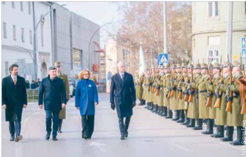
A fontos mérföldkő alkalmából ünnepséget tartottak kedden Székesfehérváron, amelyen részt vett Szlovákia, Horvátország és hazánk védelmi minisztere, valamint a NATO főtitkár-helyettese is

újabb mérföldkőhöz érkezett: „A teljes műveleti képesség elérésével a parancsnokság részt tud venni a NATO-műveletek irányításában és ellenőrzésében bármilyen lehetséges konfliktus esetén. Ez fokozza a gyors reagálási képességét, és azonnali koordinált reagálást biztosít fenyegetés esetén. Ezzel a lépéssel Magyarország ismét bebizonyította és demonstrálta elkötelezettségét a béke és a biztonság iránt.” A fehérvári NATO-elem 2019-ben kezdte meg működését. A parancsnokságot három ország, Horvátország, Magyarország és Szlovákia adja, emellett további hét NATO-tagállam is a részese. A szervezet célja, hogy megerősítse a NATO jelenlétét a keleti régióban – erről már a szövetség macedón főtitkár-helyettese beszélt az ünnepségen. Radmila Sekerinszka kiemelte, hogy a NATO egymillió ember biztonságáért felel a térségben: „A főtitkár üzenete világos: növelni kell a védelmi költségvetést, növelni kell a védelmi berendezések gyártását, és közös erővel kell a szövetség államainak garantálni a biztonságát!”