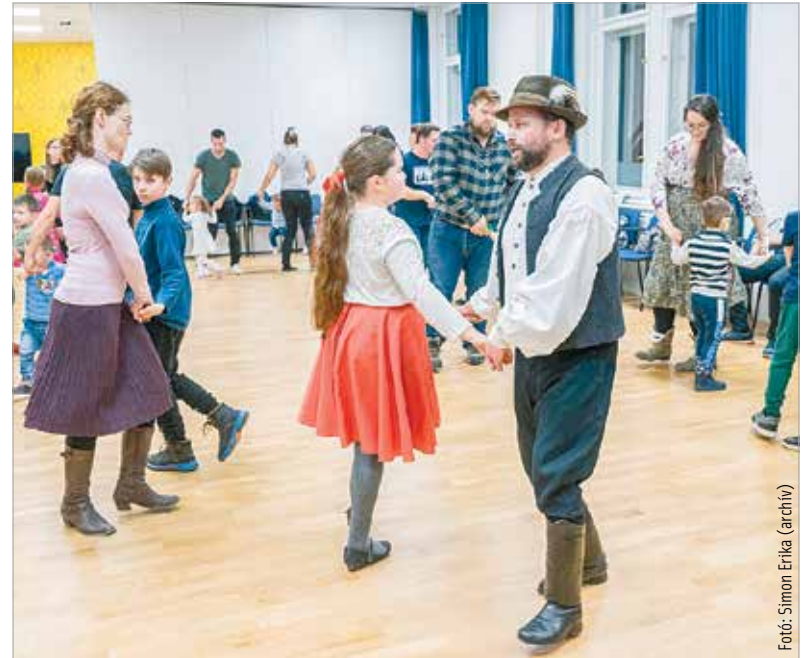
A népszerű fehérvári zenekar tavaly talált új otthonra a Mathias Corvinus Collegiumban