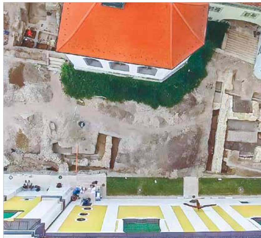
A 2014-es feltárások során ezen a helyen találták meg azt a négy oszlopmaradványt, amiből egy h

Ugye most az lenne a jó, ha egy igen vagy egy nem elhangozna. Am erre én egy hosszabb, nem kikerülő választ tudok adni. Két oldalról közelítek. Az egyik, hogy tudomásom szerint a Reich Szabina által a helyszínen feltárt régészeti anyag tudományos feldolgozása teljesen kezdeti stádiumban van. Elnézést kérek Szabinától, ha valamit rosszul tudok, de információim szerint ennek az anyagnak jelentős része még el sincs tisztítva, tehát nem is alkalmas arra, hogy tudományos feldolgozásra kerüljön. Őt ebben a helyzetben kérdezték meg, és így „kényszerült” válaszadásra. Ennek megfelelően ezek a nézetek előrehaladottabb kutatások után módosulhatnak. És másodikként a saját példánkat hoznám, amikor is azt hittük, hogy a védművek kapcsán egy periódus van. De a tudomány fejlődése során kiderült, hogy két periódusról van szó: mára bizonyított, hogy van egy Szent István korabeli korai periódus, amely egy favázis sánc volt, amit I. András (kb. 1015–1060) idején visszabontanak, és kőfallal erősítenek meg. A kérdés csak az, mennyire bontották vissza a sáncot. De az már a dendokronológiai vizsgálatok alapján egyértelműsíthető, hogy 1049 késő ősze és 1050 tavasza között vágták ki a faanyagot az ala-