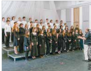
A zsűri díjazni is fogja a legjobbakat

A Magyar Kórusok, Zenekarok és Népzenei Együttesek Szövetsége 1934 óta szervez hangversenyeket. A hét évtizedes múlttal rendelkező program számos kórusnak adott már lehetőséget, hogy megmutassa magát. Az Éneklő Ifjúság Fejér vármegyei hangversenyét idén is a Székesfehérvári Községi és Kulturális Központ közreműködésével rendezi meg a KÓTA Ifjúsági Énekkari és Zenepedagógiai Szakbizottsága. A szervezők Fejér vármegyei kórusok, kamarakórusok és énekegyüttesek jelentkezését várják általános és középiskolákból, valamint egyetemekről március harmadikán, hétfőn 12 óráig. Az Éneklő Ifjúság idején hangversenyét április 15-én hallgathatja