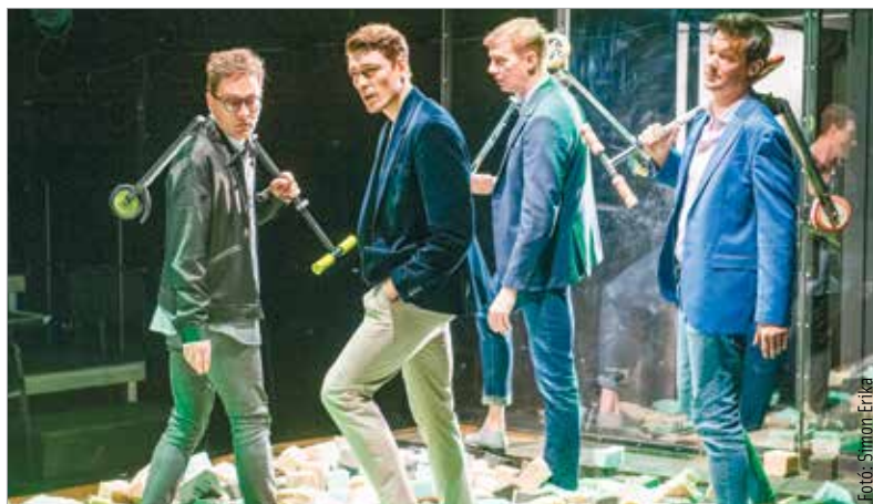
A fotó a Részegek című darab tavalyi bemutatóján készült. A színház a hétfői bemutató után február tizenötödikén újabb premierre készül: a Hegedűs a háztetőn mintegy húsz év után tér vissza a fehérvári téatrum színpadára.

„A megállapodás értelmében önkormányzatunknak legalább az állammal azonos összegű éves támogatást kell vállalnia. A 2025. évi költségvetési javaslat színházra vonatkozó része tartalmazza is ezeket a támogatási összegeket, sőt a fejlesztésekkel együtt meg is haladja azt, 611 millió forintot tesz ki. A költségvetés elfogadásával tehát lehetővé válik az állami támogatás lehívása a Vörösmarty Színház számára” – fogalmazott Cser-Palkovics András.