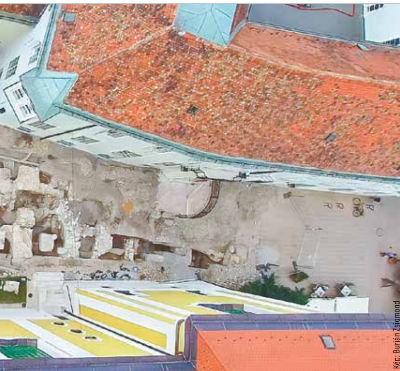
natalmas, csarnokszerű épületre következtek. Ez akár palota is lehetett.

Szücsi Frigyes számos érdekes, izgalmas kutatásról, eredményről, összehasonlításról beszélt még interjúnk során. Erdemes őt végighallgatni a Vörösmarty Rádióban vagy megnézni és meghallgatni az fmc.hu oldalon!