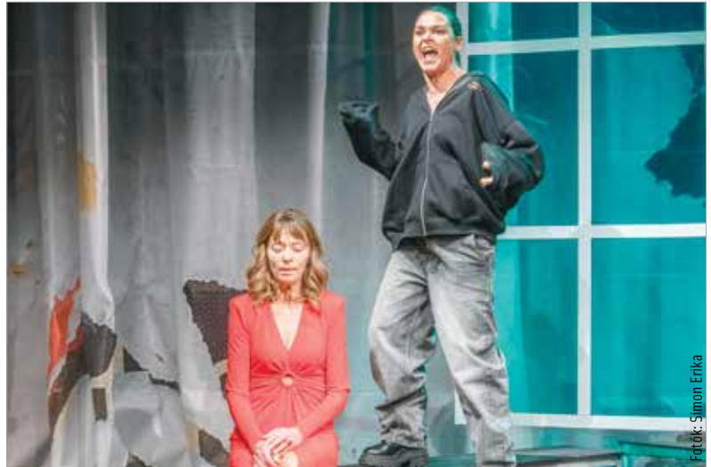
Christine és Lavínia kapcsolata nem tipikus anya-lánya viszony