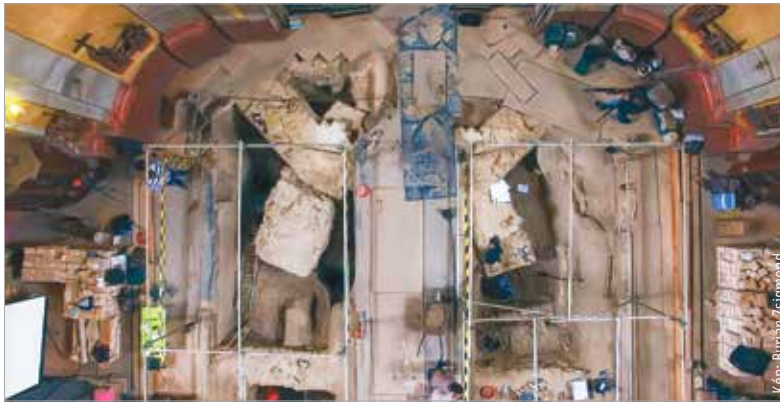
Egy évtizeddel ezelőtt a bazilika belső talapzatát is feltárták, ahol jól kivehető a négykaréjos templom alapjainak formája

Fehérvárt főleg délről és délnyugatról olyan temetők sora veszi körül az úrhidai rév felé, ahol fegyveres kíséret tagjait temették el. Ezeket a X. század második felére keltezik, de ez még problémás, mert nagyon korai feltárások. Olyan is akad, amit a XIX. században tártak fel. De abban nem kételkedik a szakma, hogy formálódó hatalmi központról van szó, igaz, hogy nem a mai történelmi belvárosról, hanem egy attól délre elterülő részről, a Sóstó környékéről, a mai Rádiótelepről, a Demkő-hegyi temetőről, a korábbi Táci úti temetkezéssről van szó. Ami új – bár nem a mi kutatásunk eredménye, de nyilvánosan már elhangzott – azt 2023-ban mondta Varga Gergely archeogenetikai, a Magyarságtudományi Intézet kutatója: a koronázobazilika körüli temetkezések osszáríumában vannak olyan emberi maradványok, amelyek radiokarbon-vizsgálata IX. század előtti időt mutat, azaz a nyolcszáz évesekből származnak. Itt tegyük tisztába, hogy a mai történelmünk azt tanítja, hogy 900 környékén veszik Árpád hadai birtokukba a Dunántúlt. Az osszáríumban vannak még emberi maradványok, amelyek