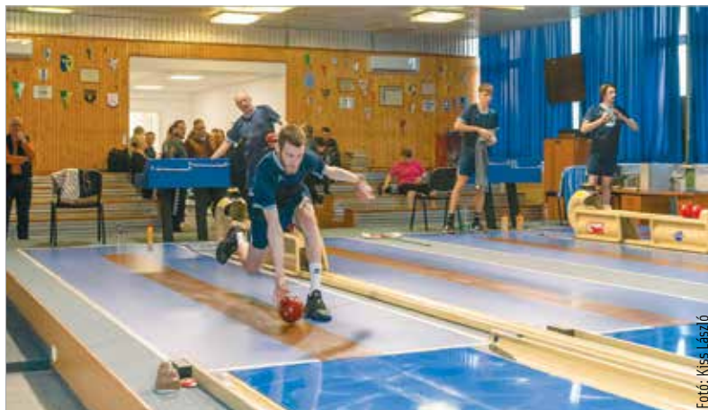
A világbajnokságra készülő magyar keret tagjai, illetve a Kőfém SC sportolói avatták fel és adták át hivatalosan is a megújult tereket