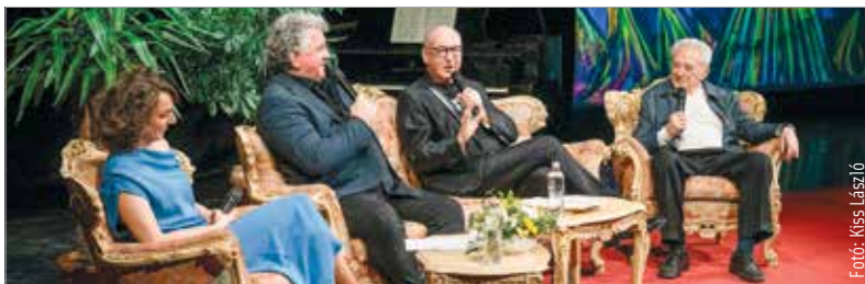
A sorozat vendégei ezúttal az opera világából érkeztek