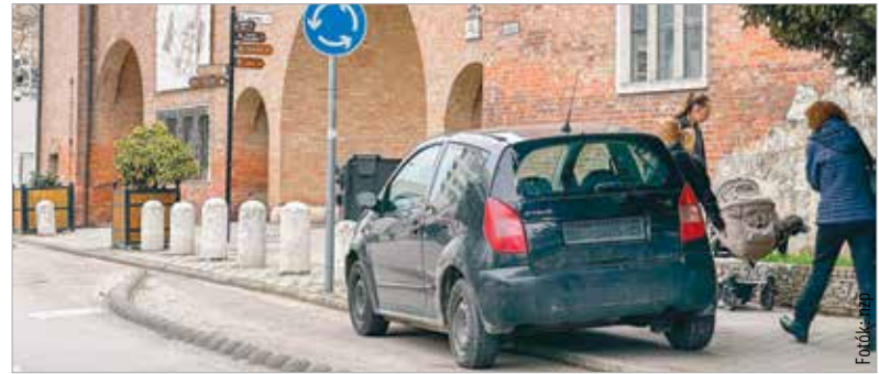
Az alapot adó gépkocsi már a városlakók kedvence lett

Az írásunk elejét biztosító autó a rendőrség jóvoltából éppen akkor került el a kapu elől, amikor a helyszínen fotóztuk.