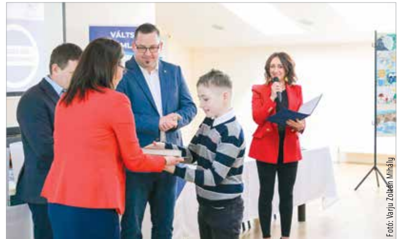
A műveket március tizedikéig lehetett beküldeni, idén közel háromszáz kép közül választotta ki a zsűri több kategóriában a három legjobbat. Mindemelllett lettek különdíjasok, illetve főtös és videós kategóriadíjas gyerekek is. A legjobb eredményeket elérők okleveleket, értékes könyvjutalmakat kaptak ajándékba.

kapcsolódóan. Az idei évben egy globális kampány részeként a gleccserek megőrzése volt a téma. A pályázatra olyan rajzokat, festményeket, fotókat és videókat vártak, amelyek a víz körforgását támogató, tudatos életvitelt, a visszafogott vízfogyasztást népszerűsítik. „Elsődleges célunk az, hogy minél fiatalabb korban megtanulják a vizeink szerepét, azok fontosságát és hogy a minőségét nekünk közösen kell megőrizni” – mondta le Oláh Zoltán, műszaki igazgatóhelyettes.