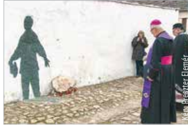
A Rác utcában Spányi Antal megyés püspök és Pavle Kaplan esperes is megemlékezett az ártatlanul kivégzettekéről

Nyolcvan esztendővel ezelőtt tragikus és véres események helyszíne volt a Rác utca. 1945 március 22-én a II. Ukrán Front katonái fegyveres erőkkel visszaélve először börtörtértek a lakóktól, majd az egyik házban rátámadtak az ott tartózkodó fiatal nőre. A család férfi tagjai a nő védelmére sietve megölték két szovjet katonát. A harmadik elmenekült és jelentette a történeteket, ami véres megtorlást vont maga után. A pincékben menedéket kereső polgári lakosokat kitelelték az utcára és agyonlőtték őket. Spányi Antal megyés püspök és Pavle Kaplan esperes közösen emlékezett meg az ártatlanul kivégzettekéről. „Fontos, hogy békességet hordozzunk szívünkben, hogy akarjuk a békét és ezért dolgozzunk, hogy kérjük a békét, hogy jöjjön el az emberek szívébe és lelkébe a gyász és a fájdalom helyébe, és ezért tudjunk áldozatot is vállalni. Hiszem, hogy Isten a mi jószándékunkat megáldja