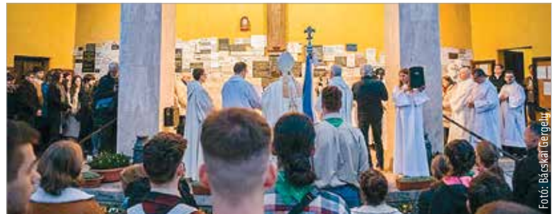
A céltudatos, elhatározásaiban kitartó, sportos fiatalembert a magyar cserkészek, a hívő fiatalok napjainkban is példaképüknek tartják