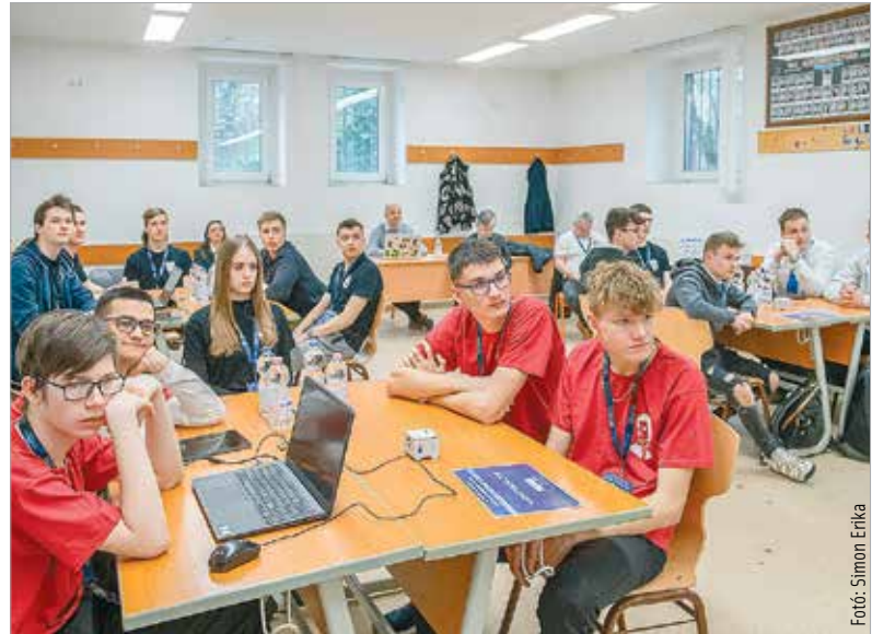
Balassagyarmatról, Budapestről, Győről, Mátészalkáról, Nagykanizsáról és Vácról is érkeztek csapatok a versenyre

döntőbe, amit már személyes részvétel mellett, a Széchenyiben rendeztek. A döntőben hat tudományágból – gépészet, elektronika, informatika, matematika, magyar nyelv és irodalom, valamint történelem – feltett kérdésekkel mérték fel a csapatok elméleti tudását, majd az interaktív kvíz után online szabadulószober segítségével tesztelték feladatmegoldó képességeiket. A döntő zárófeladata egy önálló projekt összeállítása és bemutatása volt, melyet négytagú zsűri értékel. (Forrás: ÖKK)