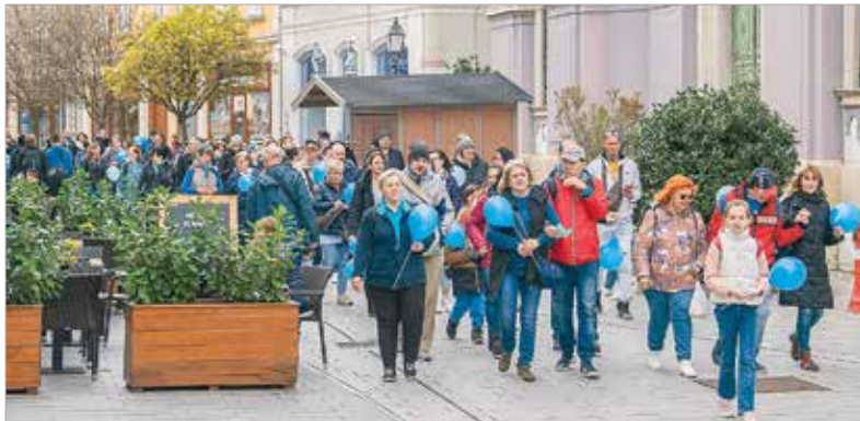
Délután a hagyományos kék sétával folytatódott a nap Székesfehérvár történelmi belvárosában Kék a szívem, kék a világ mottóval az autista gyerekek, fiatal felnőttek, valamint pedagógusaik és hozzátartozóik részvételével

a Budai út 90. szám alatti intézményben.