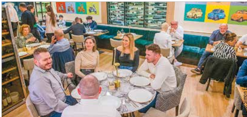
Tíz évvel a megnyitása után immár megújulva várja vissza vendégeit a város egyik legkedveltebb olasz étterme. Modern, fiatalosabb külsővel és autentikus olasz hangulattal nyitott újra pénteken a Porto Vino.