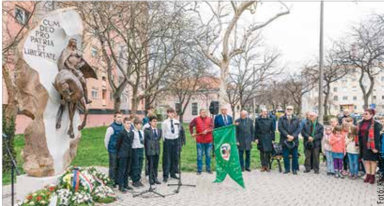
A Rákóczi-emlékmű 2022-ben közadakozásból valósult meg a Honvédség és Társadalom Baráti Kör Székesfehérvári Szervezete, valamint a Béri Balogh Ádám Baráti Kör kezdeményezésére