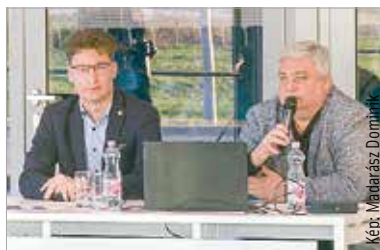
A fórumon elhangzott: a MET Aréna megépítése az állam segítségével megmentette a fehérvári jégkorongot