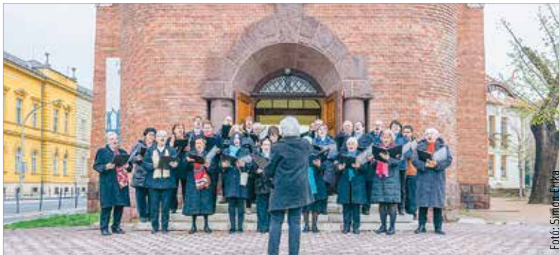
New Yorkból indult, mára pedig az ország legnagyobb komolyzenei fesztiváljává nőtte ki magát a Bach mindenkinek elnevezésű rendezvény. Székesfehérváron az esemény zárókoncertjét március utolsó vasárnapján tartották a Szekefű Gyula utcai evangélikus templomban, ahol a Székesfehérvári Ökumenikus Kórust hallhatta a közönség.