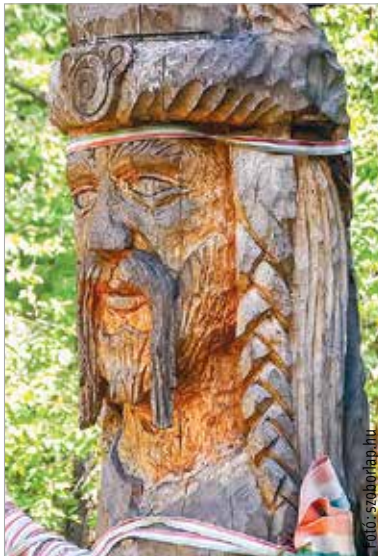
Az avarok honfoglaló vezére, Baján kagán szoboremléke az egykori ásatások helyén

és Árpád honfoglaló magyar népe előtt jó néhány ijefeszítő nép és néptörredék érkezett a Kárpát-medencébe: hunok, avarok, kutrigurok, szabiok, onogurok. Bármelyik csoportjelölő neve alatt lappanghat „előmagyar” nyelvű közösség!