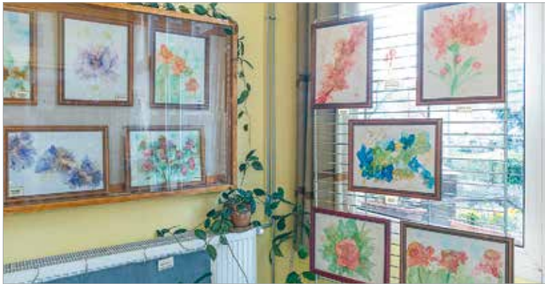
A Segíts nekem veled lenni! című kiállítás egy hónapon át látogatható a könyvtár nyitvatartási idejében