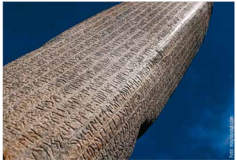
Mongólia északi részén található Orhon és a telepről elnevezett feliratos oszlopok, melyek a türkök államiségét jegyzik le

népekről. Azt véli, hogy a szkíta népek a közügyek iránt általában közömbösebbek, és sok fő uralma alatt állnak, csupán – mondja a Sztratégikon – a türkök és az avarok népe fordít gondot az egyöntetű hadrendre, és egy fő uralma alatt állnak. Azaz azt fejtegeti, hogy a sztyepei népek nem jutottak el a magas állami szerveződés szintjére, kivéve az avarokat és türk partnereiket. Háromszáz évvel később Bölcs Leó bizánci császár megírta a maga Taktika címen ismert művét, aminek elsődleges forrása a Maurikiosz-féle Sztratégikon volt, bár Leó császár irodalmi előképét nem pusztán másolta, hanem a maga korának váltoásaival is aktualizálta. Bölcs Leó is azt írta a szkíta népekről, hogy a közügyek iránt nemtörődömök és általában sok fő uralma alatt állnak, csupán a bolgárok és a rajtuk kívül álló türkök – ezek volnánk mi, magyarok – népe fordít gondot az egyöntetű hadrendre, minden másnál hatékonyabban vívják harcaikat, és egy fő uralma alatt állnak. A fő fegyver mindkét írásban az íj, nyíl, kopja. A fő hadrendet leírják: szó van mindkettőben a vezetéklovakról, a lesvetésről, a színlelt meghátrálásról, a nyílzáporról, de ír a nomád