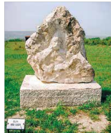
A csodás kilátással bíró Nezdé-hegyen eleink vezérei, Attila király és Csaba királyfi mellett a képen látható Baján kagan szobra is megtalálható a Szkita Golgotán

Igen, hiszen látták, hogy ez a vidék nagyon jó, a kelet-európai sztyep-