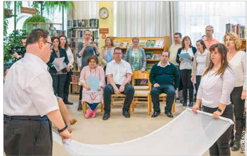
A fiatalok szívhez szóló, zenés, prózás, táncos műsora azt üzentte, hogy minden ember – állapotától és képességeitől függetlenül – része az egésznek, és a sok fáradozás, a hit és a szeretet mindig meghozza a gyümölcsét

szöveget mondott a két intézmény évek óta tartó közös munkájáért. Hangsúlyozta: sokak számára a második otthon vagy éppen magát az otthont jelenti ez az intézmény, ahol a napi szükségletek ellátása mellett sok egyéb elfoglaltságot, programot is biztosítanak a gondozottak számára. Ennek a