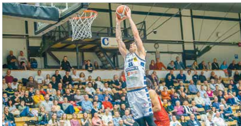
Filipovity zsákol a Honvéd elleni meccsen

a rájátszást érő nyolcadik helyen a csapat. Ennél előrébb már csak szerencsés esetben végezhet, de a pozíció megtartása sem lesz könnyű. Hétfőn Szombathelyen nem esélyesek a fehérváriak, az utolsó körben pedig Pécsre utaznak. A PVSZK ellen nyerni kell, különben az ellenfelek (főleg a Sopron) eredményeitől függhet, hogy meglesz-e a rájátszás. A riválisok közül öt csapat merleget nem sokkal jobb az Albáénál, de a papírforma szerint még mindenki szerez legalább egy győzelmet, vagyis alighanem az utolsó, még rájátszást érő helyet kell megszereznie a Fehérvárnak.