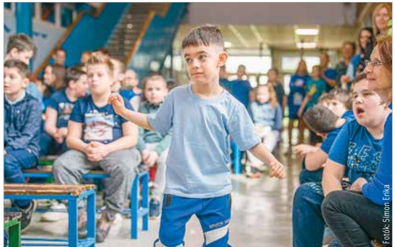
Szerda délelőtt népzenei koncertet hallgathattak az Arany János iskola tanulói, partnerintézményként csatlakozott a Székesfehérvári Hermann László Zeneművészeti Szakgimnázium és Alapfokú Művészeti Iskola is

A székesfehérvári Arany János iskola egy sokszínű, többnapos programsorozattal készült a világnapra. Hétfőn attitűdformáló, ismertető tréninget szerveztek pedagógusok számára a Németh László Általános Iskolában, míg kedden rendőrségi bemutató várta az autizmussal élő gyerekeket