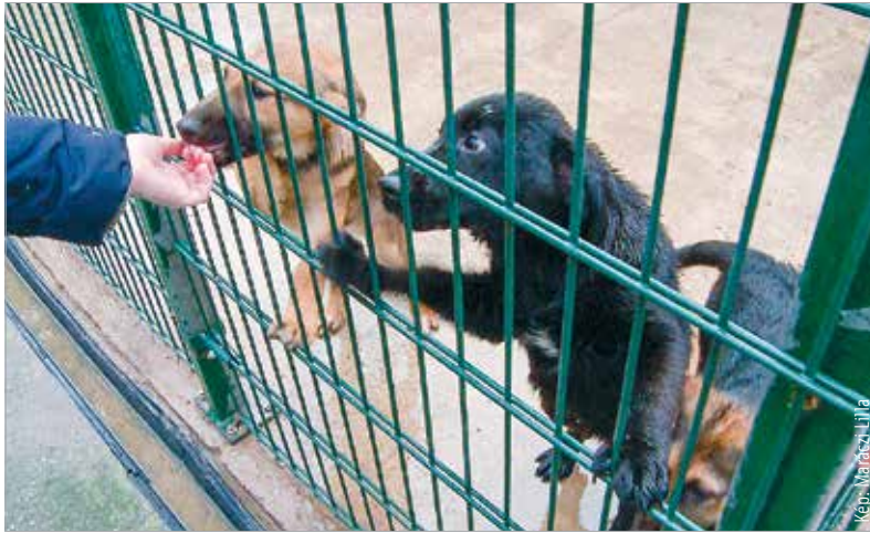
Nem nehéz összebarátkozni a menhely védeenceivel!

A toborzónapra jelentkezők egy kis előzetes elméleti oktatás után a kennelekben gyakorolhatták a feladatokat. Így felkészülhettek az olyan alapvető, kutyákkal kapcsolatos feladatokra, mint a pórázhoz, az ember közelségéhez szoktatás vagy az „ül” és a „fekszik” vezényszavak megtanítása.