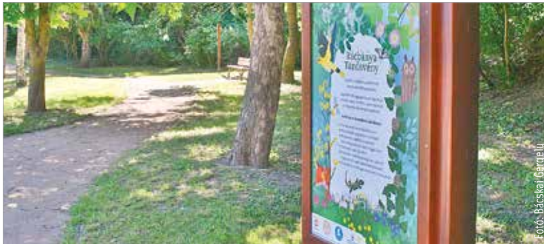
Óvodásokat és kisiskolásokat vár a Szövőmadár Meseműhely