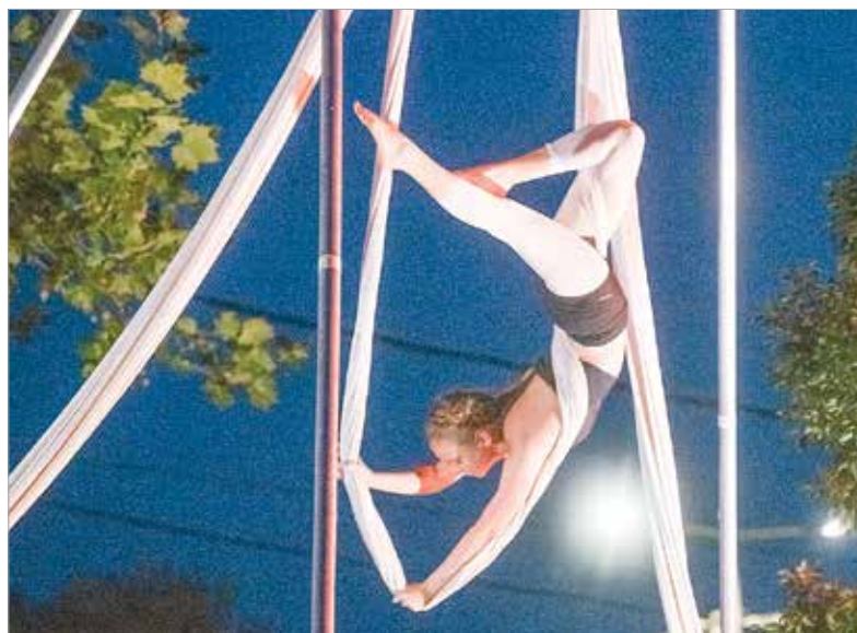
Ég és föld között