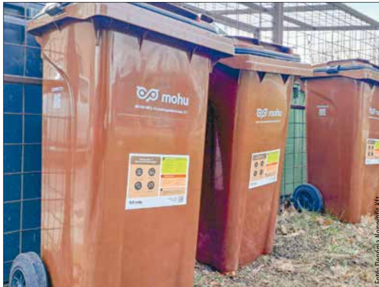
Az összegyűjtött bio- és élelmiszer-hulladékot biogázüzembe szállítják hasznosításra

Szeptember hatodikától a résztvevők Székesfehérvár szinte teljes tömbházas övezetében lakóegységeként egy-egy feliratozott, jól záródó, ötliteses konyhai gyűjtőedényt kapnak díjmentes használatra, mely nemcsak könnyen kezelhető, de szag- és kifolyásmentes is. A helyes