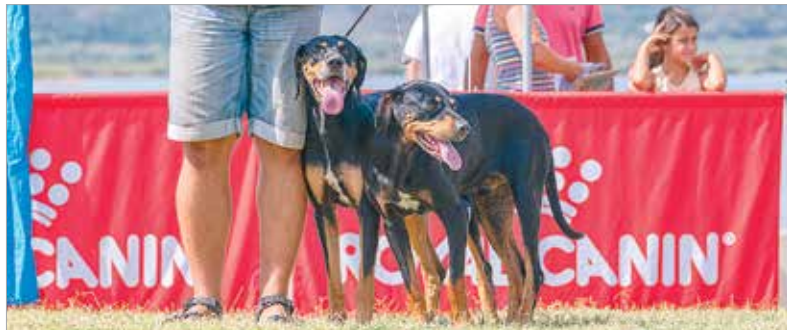
A gazdáknak fontos, hogy megmutassák kedvenceiket

Közel háromezer kutya érkezett hétvégén az agárdi szabadstrandra: az idei évben is itt zajlott a CACIB Nemzetközi Kutyaállítás. Péntektől vasárnapig várták a kutyabarátokat.