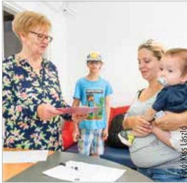
Az utalvány több mint tizennyolcezer forint értékű tanszerre váltható be