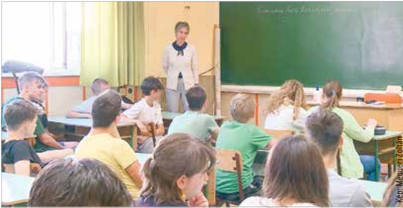
Az idei tanév szeptember másodikán, hétfőn kezdődik

Az őszi írásbeli érettségi vizsgák október 11-én kezdődnek és október 25-ig tartanak. Az emelt szintű szóbeli vizsgák november 7. és 11. között, a középszintűek november 18. és 22. között lesznek. A középiskolai központi írásbeli felvételre december 2-ig lehet majd jelentkezni, a vizsgákat pedig január 18-án 10 órától tartják majd. A szóbelik március 3. és március 20. között lesznek. Az általános iskola első évfolyamára a tanköteles tanulókat április 10-11-én kell beíratni. A tavaszi írásbeli érettségi vizsgák pedig május 5. és május 23. között kerülnek sorra.