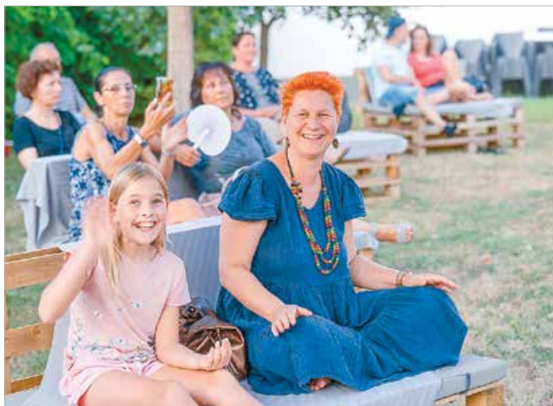
Korosztálytól függetlenül adott élményt a fesztivált