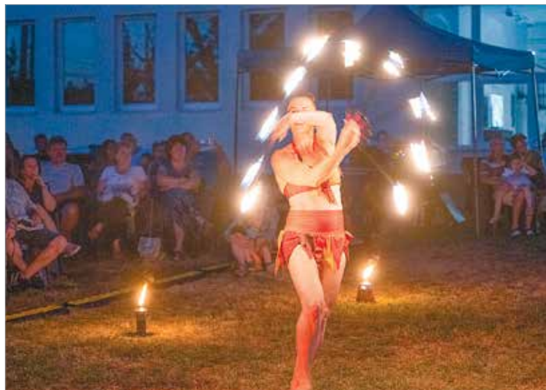
A tűzszonglőrök is nagy sikert arattak

akrobatái a tűzzel és képzeletünkkel is játszottak.