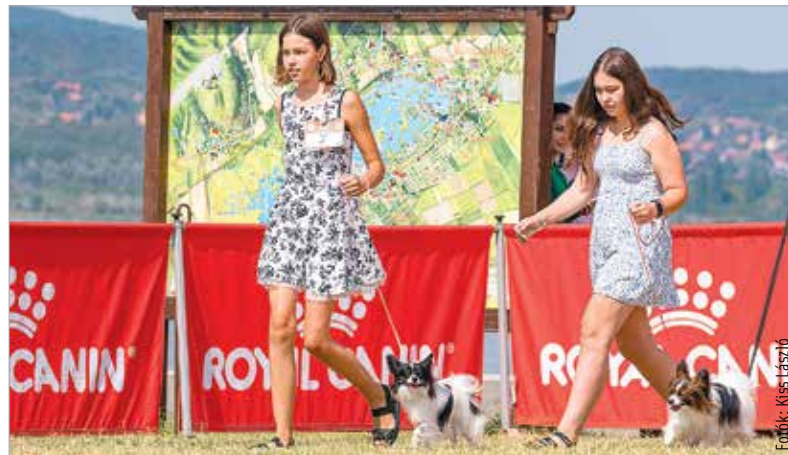
Nemcsak a szépség számít, a kutya és gazdája közötti kapcsolatot is figyelik a bírák