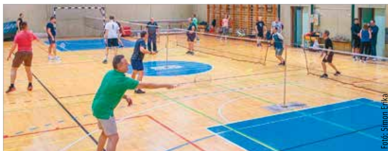
A díjmentes sportprogramokat már húsz éve támogatja Székesfehérvár önkormányzata

szeptemberben hétfői napokon is mozoghatunk több helyszínen. A Nyitott Tornatermek program az óvodásoktól a nyugdíjasokig minden korosztálynak ajánlott. A díjmentes séták immár tizenhat helyszínről indulnak, melyek közé újdonságként bekerültek a Rácbánya-tanösvény sétányai. A nordic walkingot életkortól és nemtől függetlenül bárki végezheti, nem kell hozzá speciális előképzettség, nem terheli túl az mozgásszerveket, nem okoz izomlázat és ízületi fájdalmat. Hatékonyabb a botok nélküli sétánál, jó hatással van a szív- és érrendszerre, az anyagcserére, a mozgásszervekre, a hormonháztartásra és az immunrendszerre. Székesfehérváron sokan igénybe veszik, így komoly közösségépítő hatása is van. A gyalogláshoz szükséges botokat ingyenesen biztosítják. (Forrás: ÖKK)