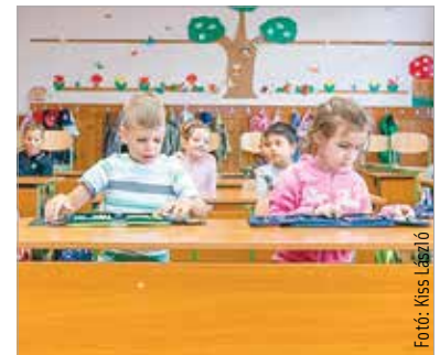
Fontos, hogy megtanítsuk a gyerekeknek, hogy mindig kezet kell mosni étkezés előtt. Aludjanak és mozogjanak eleget, táplálkozzanak okosan, így elkerülhetik az őszi betegségeket!

A háziorvos hozzátette: ami az egyik legfontosabb az egészséges életmódhoz, az az elegendő alvás. A szülőknél is oda kell figyelniük az alvás minőségére, hiszen ezt látják mintaként a gyerekek. Az időben való elalvást nem szeptember elején kell elkezdni, hanem két héttel a tanévkezdés előtt: „Mire jön az iskola, érdemes visszaáll-