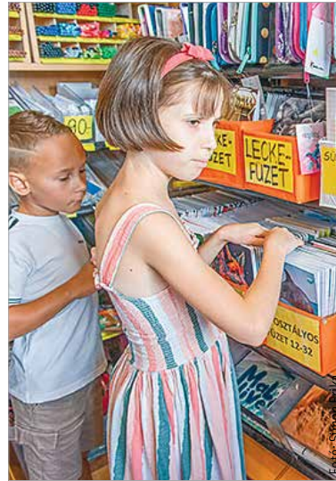
Sokan már a nyár folyamán elkezdték a beszerzést, de azért ilyenkor is akadhat még számos olyan dolog, ami kimaradt a listából

Alig pár nap van hátra a nyári szünetből. A diákok többsége kevésbé, a szülők azonban lázasan