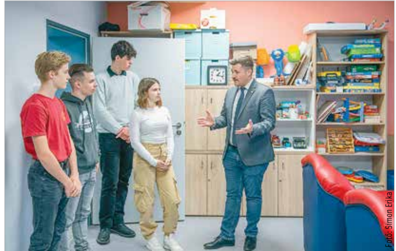
Középiskolás és egyetemista fiatalok ismerhették meg az intézmény által biztosított szolgáltatásokat, a munkatársakat, valamint a városban ezen a területen dolgozó civilszervezeteket

a járásban élők megismerjék az intézményben végzett munkát, hiszen ritka az, amikor ilyen módon megnyílnak a kapuk. Nagy hálával tartozik az önkormányzat a szociális területen dolgozóknak – ezt már Mészáros Attila alpolgármester mondta a rendezvény megnyitóján, majd kiemelte: fontos és jelentős munkát végeznek a rászorulókért, amit az önkormányzat igyekszik is meghálálni.