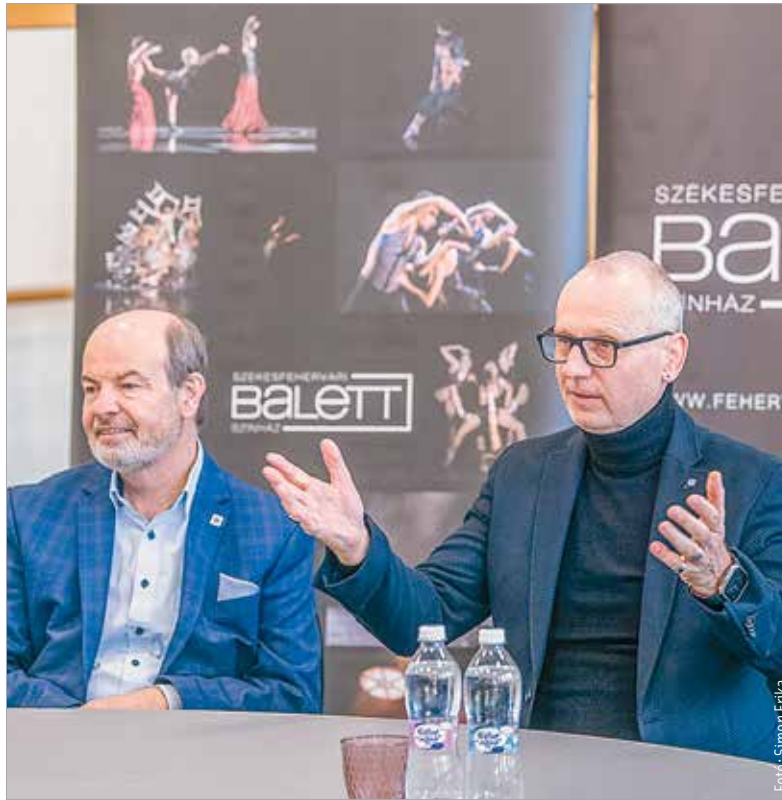
A Tűzmadár bemutatója november huszonkettedikén lesz a Vörösmarty Színházban

A bemutatóról szóló sajtótájékoztatón Egerházi Attila elmondta, hogy a mű cselekménye a jó és a rossz örök párharcára épül. A tűzmadár karaktere az intuíció, valamint a halhatatlan lélek metaforájaként jelenik meg a darabban: „Ha a kortárs táncszínházról beszélünk, akkor mindenkinek eszébe kell, hogy jusson a Tűzmadár! Egy orosz népmese alapján írta Sztravinszkij a zenét, de már Maurice