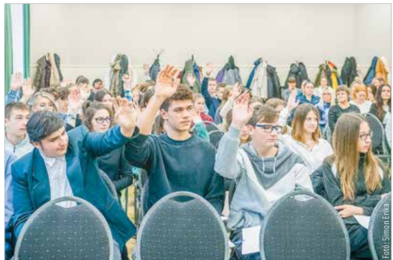
A Diákrparlamentben és a Diáktanácsban is fontos az aktív jelenlét