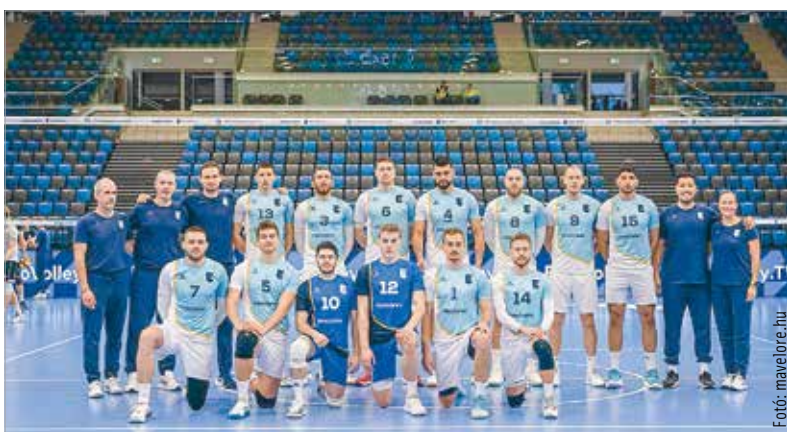
A MÁV Előre férfi röplabdázói még versenyben vannak a legjobb tizenhat közé jutásért