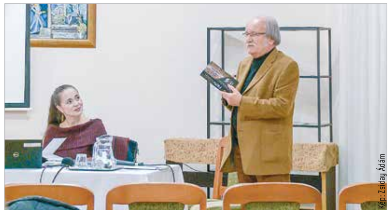
A bensőséges hangulatú diskurzus eddig nem ismert adalékokkal szolgált a kötet megszületésének történetéről

A kötetben nyelvemlékrészletek és a rendi krónika, a nagy pálos szónokok prédikációinak részletei, valamint Virág Benedek, Anyos Pál és Verseyhgy Ferenc művei és a hozzájuk kapcsolódó szövegek mellett Martinuzzi Fráter György robusztus alakja is feltűnik, illetve a küzdelmes huszadik századot is bemutatják a pálos atyák emlékirataiból válogatott szemelvények.