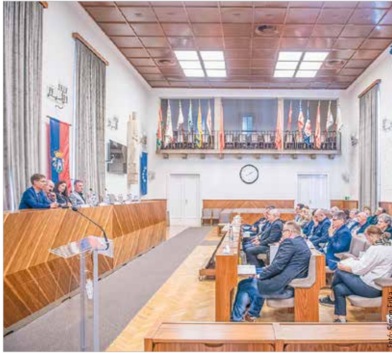
Huszonöt városból érkeztek vendégek a kétnapos eseményre

A kétnapos találkozón az egyesületet alkotó huszonöt település képviselői vettek részt. Az egyes városok saját egészségmegőrző programjait mutatták be. Ahogy De Blasio Antonio elnök hangsúlyozta, ezek azért is fontosak, mert az egészség csak részben az egészségügy felelőssége: számos egyéb tényező mellett a társadalmi környezetben is sok múlik. Latorcai Csaba, a Közigazgatási és Területfejlesztési Minisztérium államtitkára, az esemény fővédnöke beszédében kiemelte, hogy a városok szerepe egyre nagyobb az életminőség biztosításában. Az „egészséges város” koncepciója nemcsak a fizikai egészség, hanem a közösségépítés, a környezetvédelem, a fenntarthatóság és a lelki jólét szempontjait is magában foglalja. Rámutatott