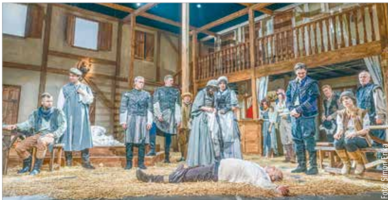
A Komáromi Jókai Színház és a székesfehérvári Vörösmarty Színház közös produkciója Kovács Yvette Alida jelmezeivel és díszleteivel, Szirtes Edina Mókus zenéjével hamisítatlan reneszánsz komédia

zasság, féltékenység, pénz – meg persze hazugságok és cselszövések, álhűk és szerepcserék minden mennyiségben. Főszereplője Falstaff, a korhely lovag, akinek az a terve, hogy elcsábítja Windsor városának két gazdag asszonyát, és kiüríti férjeik pénztárcáját. Am az asszonyokat sem ejtették a fejük lágyára! A csábítási terv dugába dől: valahogy mindig mindenki ott sertepertél a légyottok helyszínén, s a remélt hódításból végül nagy leckétetés lesz.