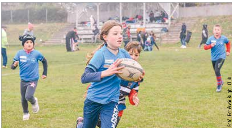
Lányok, fiúk és a tojáslabda – Fehérváron ez kell a sült krumplihoz!

maguk gondoskodtak a rendezvény nevét adó sült krumpli alapanyagáról. Ebben az évben azonban a fehérvári klub lelkes és támogató szülői csapata összefogott. Már a verseny előtt napokkal lázasan készítették elő azt a több mint nyolcvan kiló krumplit, amit aztán a játékosok és a szurkolók jóízűen elfogyaszthattak. Ezenfelül az önkéntesek friss palacsintával és teával próbálták melegen tartani a játékosokat a zord időben. A rendező klub mellett az István Király és a Táncsics általános iskola csapatai képviselték a fehérvári színeket.